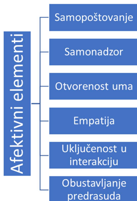
Slika 3. Afektivni elementi interkulturalne komunikacije (Chen i Starosta, 2000)

Pri izradi skale interkulturalne osjetljivosti, Chen i Starosta usredotočili su se na afektivne aspekte interkulturalne komunikacije, pri čemu je njihovo prvo istraživanje provedeno na 168 studenata prve godine komunikacijskih studija pomoću instrumenta koji je imao 73 tvrdnje. Tom su prilikom koristili peterostupanjsku skalu procjene Likertova tipa gdje je 5 označavalo „u potpunosti se slažem“, 4 „slažem se“, 3 „neodlučan sam“, 2 „ne slažem se“ i 1 „nimalo se ne slažem“. Nakon obrade rezultata, sve tvrdnje koje su imale ukupnu korelaciju veću od 0.50 prihvaćene su za istraživanje, dok su ostale odbačene. U drugom istraživanju skala je imala 44 tvrdnje umjesto prvotne 73. Cilj je bio definirati faktorsku strukturu te 44 tvrdnje. Istraživanje je provedeno na uzorku od 414 studenata među kojima je napravljena faktorska analiza rezultata. Dobiveno je 5 faktora: angažiranje, poštivanje kulturnih razlika, povjerenje prilikom interakcija, uživanje u interakcijama i svjesnost o interakciji. Krajnji broj tvrdnji smanjen je s 44 na 24. U trećoj fazi istraživanja, Chen i Starosta su svoju skalu usporedili s instrumentima koji imaju karakteristike slične njihovima, kao što su Skala pozornosti pri interakciji (Cegala, 1981), Skala samopoštovanja (Rosenberg, 1965), Skala samokontrole (Lennox i Wolfe, 1984) i Skala perspektivnog uzimanja (Davis, 1996), pri čemu su potvrdili značajnu korelaciju između svoje Skale interkulturalne osjetljivosti i svih spomenutih instrumenata (Drandić, 2013).