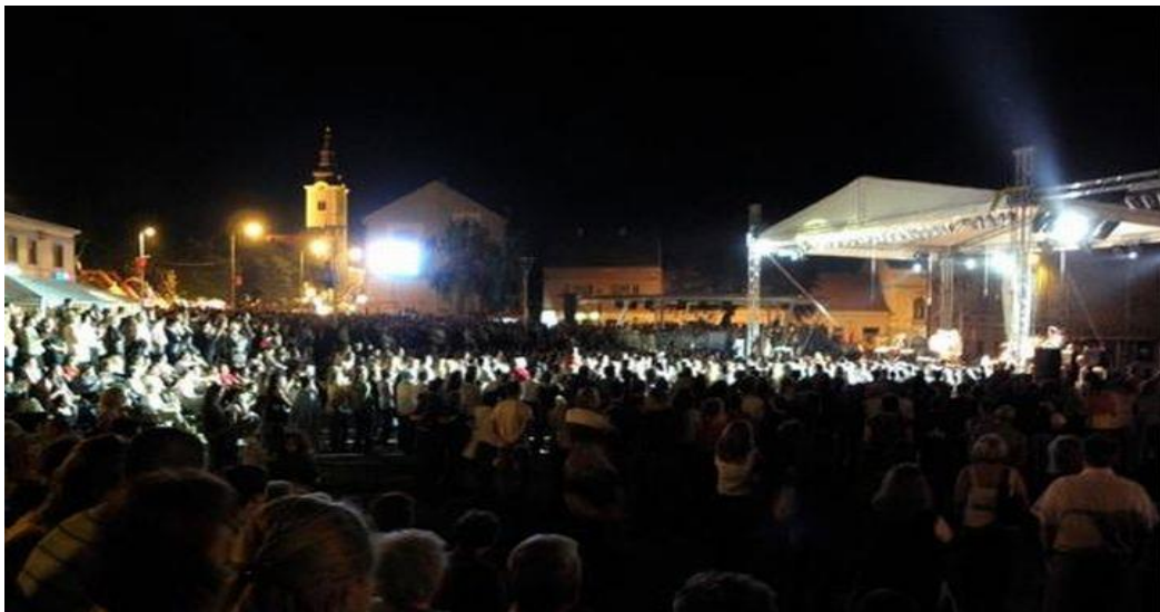
Sl. 4. Večernji koncert na Križevačkom Velikom Spravišću

Križevački statuti pravila su lijepog ponašanja za stolom. Pisani su na kajkavici kakva se nekad govorila u ovim krajevima, a od koje su danas ostali samo tragovi. Još uvijek je u svakodnevnom govoru koristi samo starije stanovništvo, dok je mlađe stanovništvo djelomično upoznato s tim rječnikom i koristi ga samo u svrhu šale i zabave. U statutima se glazba spominje u tri regule (pravila). Pravilo pod brojem 15. u kojem piše da se u pajdašiji (društvu) mora imenovati popevač (pjevač) koji će biti odgovoran za glazbu i pjevanje. Pravilo pod brojem 19. određuje da je dužnost popevača voditi svaku pjesmu koju odredi oberfiškuš (desna ruka stoloravnatelja), te da tu dužnost može obavljati i ženski član pajdašije . Dok pravilo broj 47. naglašava da se nikoga u pajdašiji ne smije izostaviti i svakome se mora nazdraviti, te određuje da se posebno mora nazdraviti domovini, bratstvu i kućedomaćinu. Kod nazdravljanja domovini mora se otpjevati prigodna domorodna pjesma, a kod ostalih, nazdravica (zdravica) pjesme biraju oberfiškuš i popevač .