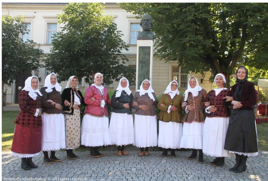
Sl. 3. Ženski vokalni sastav „Križevačke gospoje“ (preuzeto sa službenih stranica KUD-a „Prigorje“)

„Društvo je tijekom dugog niza godina uspješno sudjelovalo na brojnim manifestacijama, a 2016. plasirali su se na državnu smotru pjevačkih sastava u Bjelovaru te državnu smotru izvornog folkloru u Koprivnici gdje su predstavljali Koprivničko-križevačku županiju između 14 izvornih skupina iz cijele Hrvatske, što do sada smatraju i svojim najvećim uspjehom.“ 15