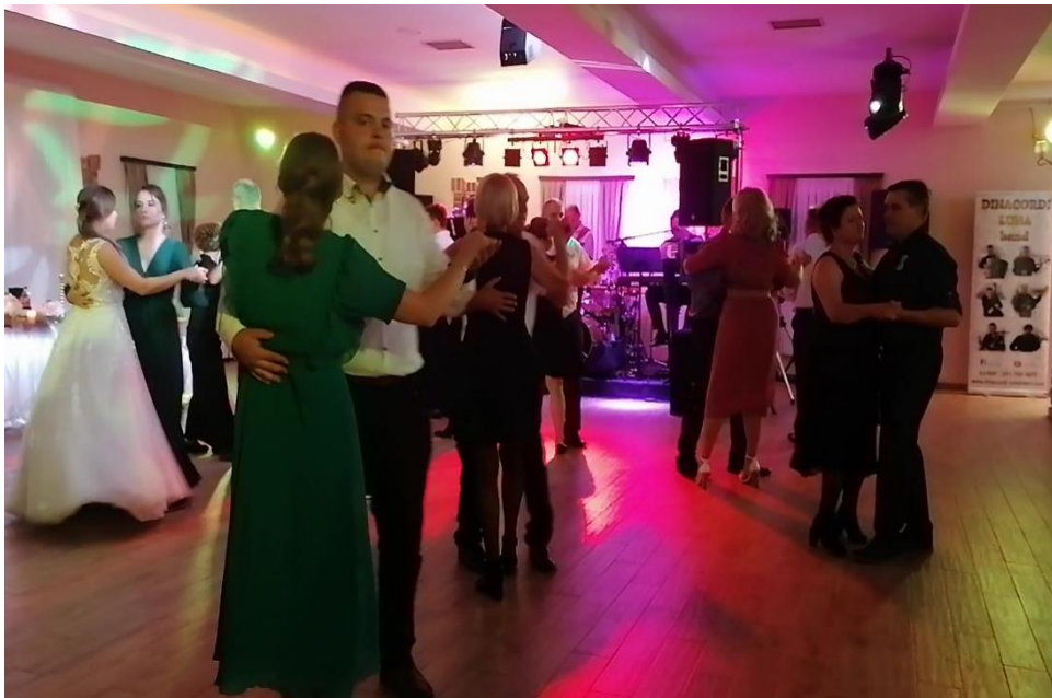
Sl. 5. Svadba u Cepidlaku (19.9.2020.,)

Tijekom privatnih proslava ljudi angažiraju glazbeni sastav prema dvama kriterijima: cijena i kvaliteta. Što popularniji i kvalitetniji sastav, to je veća cijena za njihov angažman. Glazbeni sastavi sastoje se od tri do pet članova, a uobičajeni instrumenti kojima se sastavi na ovom području koriste su harmonika, klavijature, bubnjevi i električna gitara, ponegdje i violina. Sastavi najčešće imaju jednog glavnog vokala i nekoliko pratećih. Članovi tih sastava uglavnom su glazbeni amateri koji su naučili svirati po sluhu , ali postoje i oni koji su pohađali glazbenu školu. Sviranje u takvim bendovima nije im glavni izvor zarade, te tijekom tjedna rade kao zaposlenici u tvrtkama, dok vikendima tamburaju .