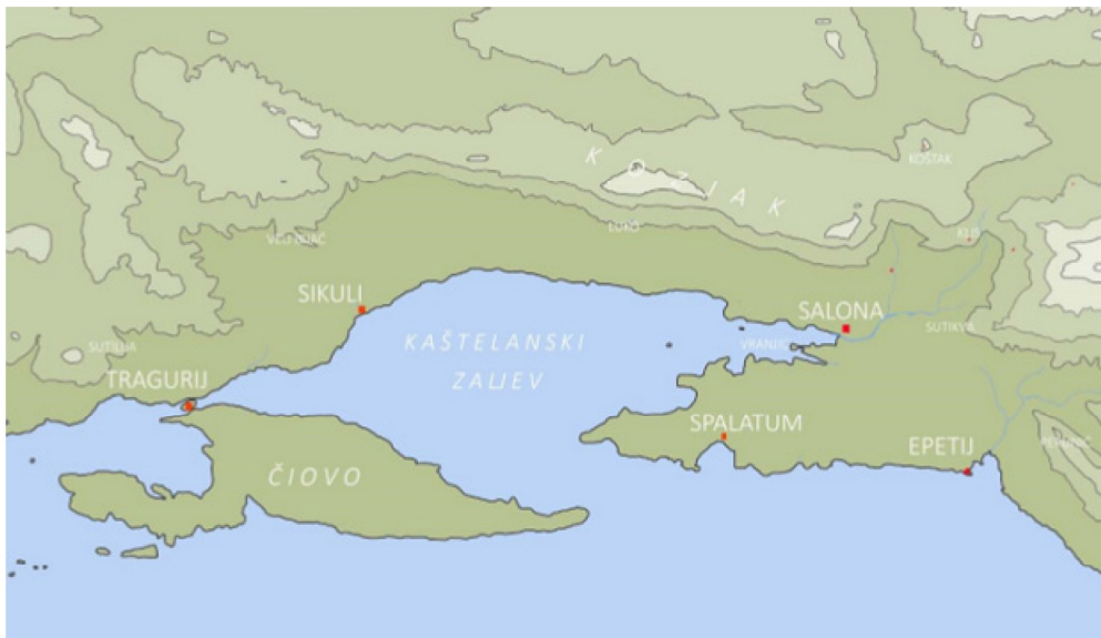
Karta 3. Karta Kaštelanskog zaljeva (preuzeto iz: ŠUTA, I., 2017, 27.)

Najstariji nalazi importirane grčko-helenističke keramike na području Tragurija jesu: atički krater koji se datira u V. st. pr. Kr. i apulski riton koji se datira u IV. st. pr. Kr. Najčešće se nalazi helenističke keramike koja je pronađena na području Trogira datiraju u III. i II. st. pr. Kr. To su obično ostatci keramike tipa Gnathia , crnopremazane helenističke keramike ili keramike tipa West slope . Nalazi sivopremazane i reljefno ukrašene helenističke keramike datiraju se nešto poslije, u II. i I. st. pr. Kr. Budući da je dekor na reljefnim helenističkim čašama iz Tragurija, od kojih valja istaknuti motiv dupina, rozeta i lišća lotosa usporediv s motivima na reljefnim čašama isejske produkcije, vrlo je moguće kako su proizvedene lokalno. Pretpostavlja se kako su čaše koje su pronađene u Traguriju proizvedene u helenističkom naselju koje se nalazilo na položaju Resnik-Sikuli, jer u Trogiru, za razliku od Resnika, nema nalaza kalupa koji bi dokazali produkciju keramike. 86 Udaljenost od Trogira do Resnika iznosi oko osam kilometara. 87