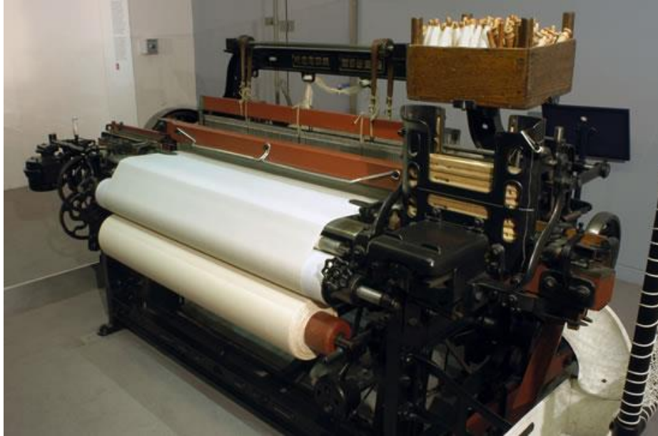
Slika 1. Automatizirani tkalački stroj tvornice Toyota