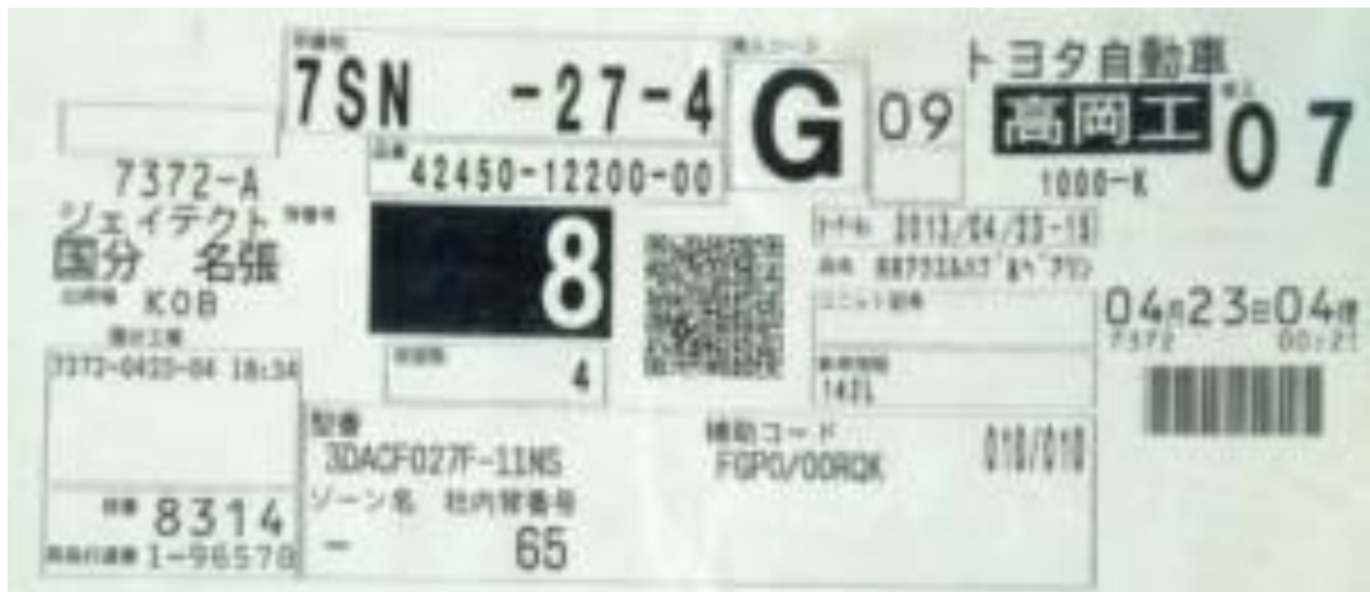
Slika 2. Naručivanje putem KANBAN kartice u Toyotinom proizvodnom sustavu