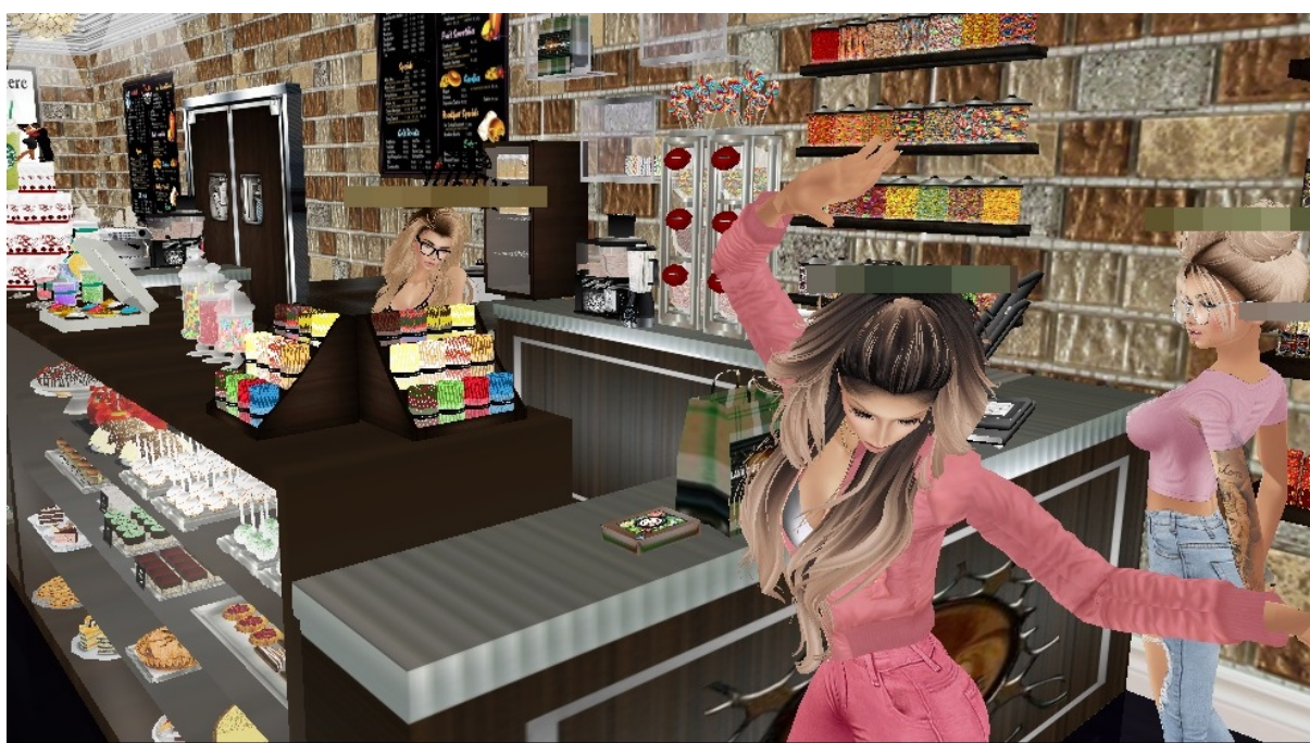
Slika 5. Prikaz tehničkih mogućnosti chata : ples avatara