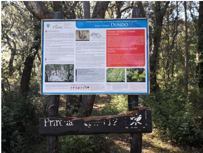
Slika 6. Poučna ploča u šumi Dundo

Ekološka mreža Natura 2000 obuhvaća cijeli otok Rab, pa tako i posebni rezervat šumske vegetacije Dundo, pod identifikacijskim brojem HR2001359. Otok Rab uvršten je u ekološku mrežu Natura 2000 (slika 7.), kao područje od velike važnosti za očuvanje ugroženih vrsta ptica i staništa na kojima te ptice obitavaju. Na ovom području posebno se štite vrste ovisne o otvorenim predjelima. Takva vrsta je bjelonokta vjetruša ( Falco naumanni Felischer) čije je jedino poznato mjesto gniježđenja na Rabu. Na Rabu obitavaju i druge ugrožene ptičje vrste poput, sove ušare ( Bubo bubo L.), bjeloglavog supa ( Gyps fulvus Hablizl), zmijara ( Circaetus gallicus Gmelin), legnja ( Carimulgidae Vigors), sivog ćuka ( Athene noctua Scopoli), ševe krunice ( Lullula arborea L.) i primorske trepteljke ( Anthus campestris L.) (Udruga Biom).