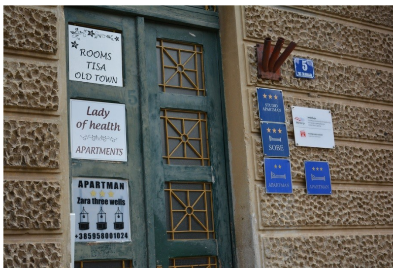
Slika 18. Natpisi na engleskom jeziku (lijevo) te na hrvatskom jeziku (desno) za smještajne jedinice na Trgu Tri bunara (14.10.2018.)

(23,10%), koji uglavnom uključuju ploče s nazivima ulica, prometne znakove, objekte u prostoru, parkirne automate i znakove; kod trgovačkih (TRG) natpisa (13,29%) i ugostiteljskih (UGO) natpisa (6,31%), koji uključuju obavijesti o radnom vremenu i podatke o tvrtki; kod smještajnih (SMJ) natpisa (5,45%), koji uključuju pločice s vrstom smještajnog prostora koje su zakonski propisane; i druge vrste koje su zastupljene u manjem broju.