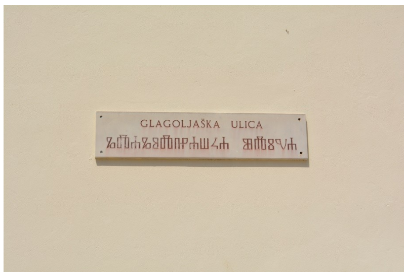
Slika 11. Latinica i glagoljica na natpisu u Glagoljaškoj ulici (4.8.2013.)

Zaključno, u četvrti Relja i Jazine primjećuje se polagan rast broja privatnih natpisa i rast broja višejezičnih natpisa. Privatni natpisi generiraju veću raznolikost u jezičnom krajoliku. Hrvatski je najbrojniji prvi jezik natpisa te je 2. na popisu drugih jezika natpisa. Engleski jezik slijedi hrvatski na popisu prvih jezika natpisa, dok je na vrhu popisa drugih jezika natpisa. Taj nam podatak govori da je hrvatski primarni jezik pisane komunikacije ove gradske četvrti, a engleski služi kao pomoćni jezik. Uz ta dva jezika mogu se vidjeti i talijanski i njemački. Hrvatski je najčešći na reklamama, objektima i na informativnim natpisima, dok je engleski najviše prisutan na reklamama. Relja i Jazine su prvenstveno