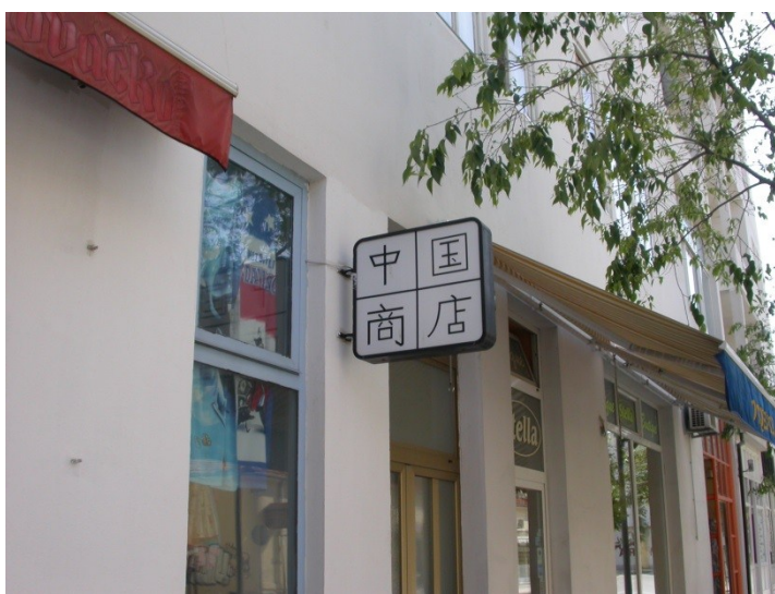
Slika 9. Reklama na kineskom jeziku na Relji (28.4.2012.)

Osim pretežitog latiničnog pisma, u jezičnom krajoliku ove četvrti nalazimo kinesko pismo i glagoljsko pismo. Kinesko pismo korišteno je na reklamama i u izlogu kineske trgovine (v. Slika 9), dok je glagoljsko pismo korišteno na grafitu posvećenom zadarskom nogometnom i košarkaškom klubu (v. Slika 10). Osim na grafitu, glagoljica je prisutna i u Glagoljaškoj ulici koja se nalazi odmah pored Samostana sv. Ivana Krstitelja u kojem franjevci trećoredci stoljećima čuvaju glagoljaštvo (v. Slika 11). Istočni zid Glagoljaške ulice urešen je kamenim pločama u koje su uklesana sva glagoljska slova. S obzirom na dinamiku jezičnoga krajolika, u 2019. godini kineskoga teksta više nema u javnom prostoru ove gradske četvrti, dok je glagoljica i dalje prisutna: kameni natpisi su i dalje tamo, no grafit bi mogao biti uklonjen zbog intenzivnih građevinskih radova u pozadini zida na kojem se tekst nalazi.