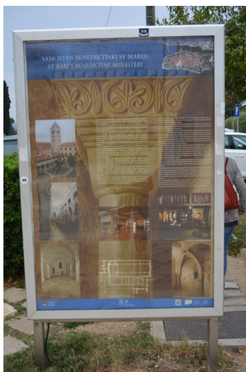
Slika 20. Informativni natpis o Samostanu sv. Marije na hrvatskom i engleskom jeziku (21.10.2018.)