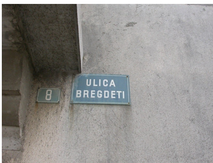
Slika 5. Ploča s nazivom ulice u Arbanasima (22.4.2012.)

Zaključno, Arbanasi se nalaze na periferiji područja koje smo analizirali i primarno su stambenog karaktera s vrlo malim brojem poslovnih prostora i djelatnosti. Zbog toga je najveći broj natpisa u javnom prostoru infrastrukturnog karaktera i službenog autorstva (v. Slika 5). Samo četvrtina natpisa privatnog je autorstva, a takvi natpisi uglavnom pripadaju ugostiteljskoj, trgovačkoj ili smještajnoj djelatnosti. Hrvatski je najčešći jezik u jezičnom krajoliku Arbanasa. Mađarski je drugi, ali nema nikakvu simboličku ili informativnu funkciju jer je njegova prisutnost slučajna. Iz svih je primjera jasno da je hrvatski glavni jezik pisane komunikacije u javnom prostoru Arbanasa. Značajno je i da u jezičnom krajoliku nije zabilježen nijedan primjer teksta na arbanaškom jeziku.