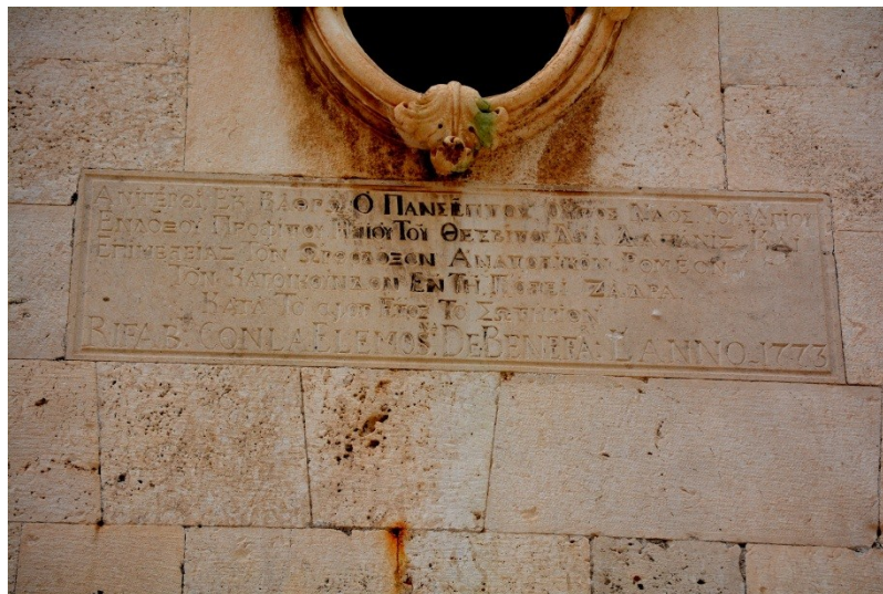
Slika 17. Natpis na grčkom i talijanskom jeziku na crkvi sv. Ilije Proroka na Poluotoku (14.7.2013.)

institucijama. Grčki i srpski jezici prisutni su u jezičnom krajoliku Poluotoka samo na po jednom natpisu, oba na srpskoj pravoslavnoj crkvi sv. Ilije Proroka, koja je u prošlosti služila grčkim trgovcima (v. Slika 17).