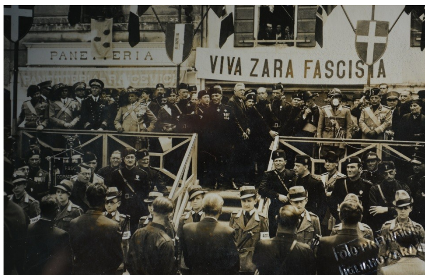
Slika 27. Jezični krajolik Zadra u vrijeme fašizma.

Natpisi s nadgrobnih spomenika s Gradskog groblja pokazuju nam raznolikost koje više nema u vertikalnom jezičnom krajoliku Zadra, a možemo pretpostaviti da je takva raznolikost postojala i u javnom prostoru grada. Za vrijeme fašističke vlasti u Zadru javni je prostor također sadržavao mnoge režimske natpise i parole (v. Slika 27). Promjenama vlasti i režima vertikalni se jezični krajolik briše ili korigira te se postavljaju natpisi koji su u skladu s novom ideologijom.