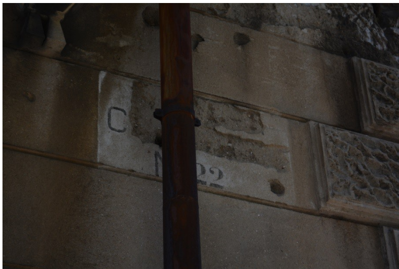
Slika 31. Ploča s nazivom ulice iz razdoblja talijanske uprave, danas u Ulici Bože Peričića (4.8.2013.).

U zadarskom jezičnom krajoliku nije, dakle, zanimljivo samo ono što tamo jest, već je zanimljivo i ono čega nema. Iz primjera Gradskog groblja te s fotografija i razglednica Zadra možemo vidjeti da je nekadašnja jezična raznolikost bila bogata, ali u vertikalnom jezičnom krajoliku Zadar ta se raznolikost više ne vidi, što znači da je kroz prošla desetljeća ona izbrisana tijekom društvenih promjena. Tragovi tih promjena najbolje se vide na kamenim pločama iz prethodnih stoljeća koje sadrže tekstove na latinskom ili talijanskom jeziku (v. Slika 32), a neki dijelovi tih tekstova uklonjeni su dlijetom i čekićem. Na Slici 31 uklonjen je naziv ulice na talijanskom jeziku, a ostavljen je kućni broj. Na slične ploče iz razdoblja talijanske uprave samo je odozgo dodana ploča na hrvatskom jeziku.