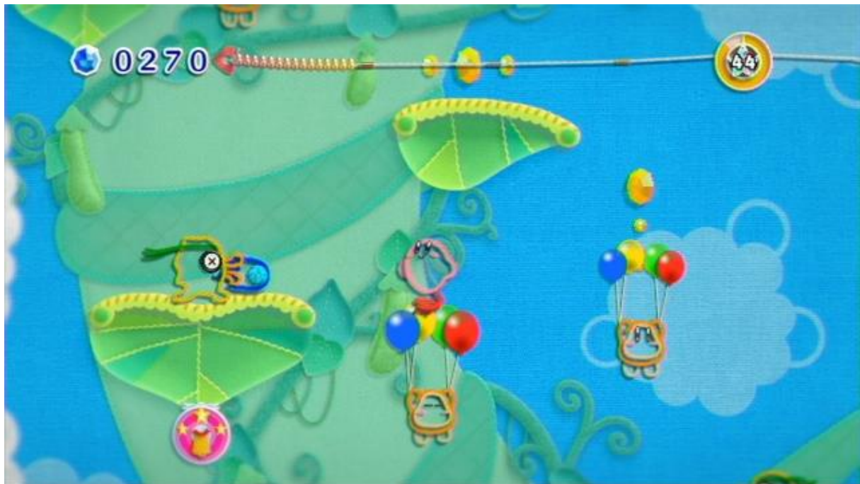
Slika 2. Prikaz igre Kirby's Epic Yarn .

S obzirom na postavljene ciljeve određena je i objektivna mjera uspješnosti u igrama. Za igru s visokim razinama kazni (Jump King) mjera uspješnosti je bila efikasnost u uspinjanju do vrha tornja, odnosno omjer skokova i padova u igri, dok je za igru s visokim razinama nagrada (Kirby's Epic Yarn) mjera uspješnosti bila broj skupljenih virtualnih dragulja i ukrasa.