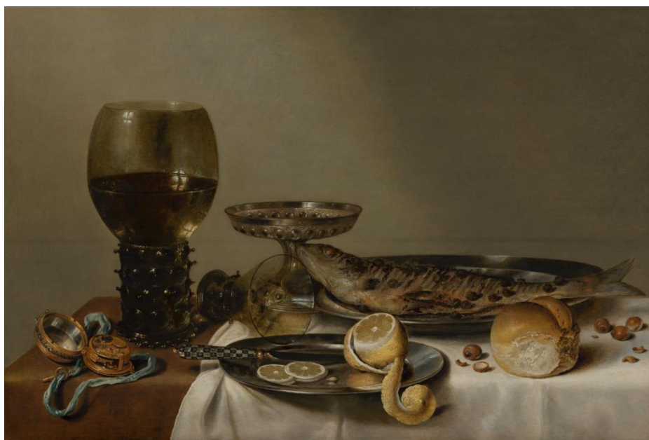
Prilog 11. Willem Claesz. Heda, Mrtva priroda s roemer čašom i satom, 1629.