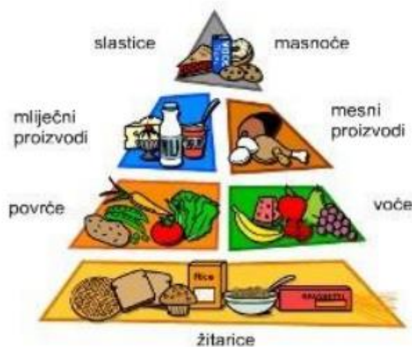
Slika 3. Piramida zdrave prehrane