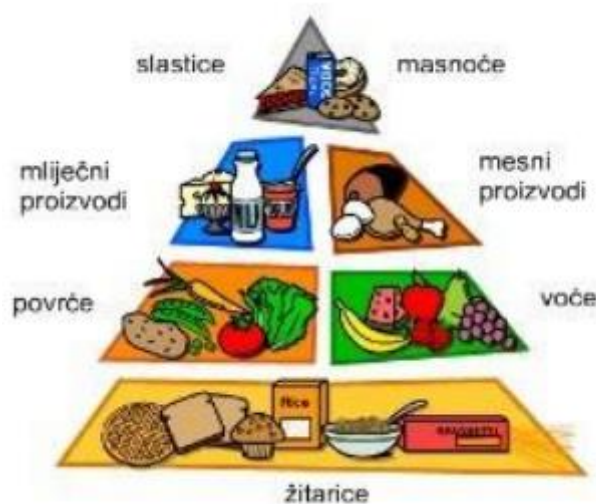
Slika 3. Piramida zdrave prehrane