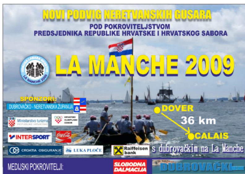
Slikovni prilog 5. La Manche

S lađom se preveslao Jadran, La Manche, veslalo se na Jarunu, posjećuju se Vinkovačke jeseni, lađa je bila u Francuskoj na sajmu brodovlja, a prema riječima predsjednika Udruge pokušava se organizirati da lađari s lađom posjete još nekoliko manifestacija, kako bi se za lađu i maraton više čulo.