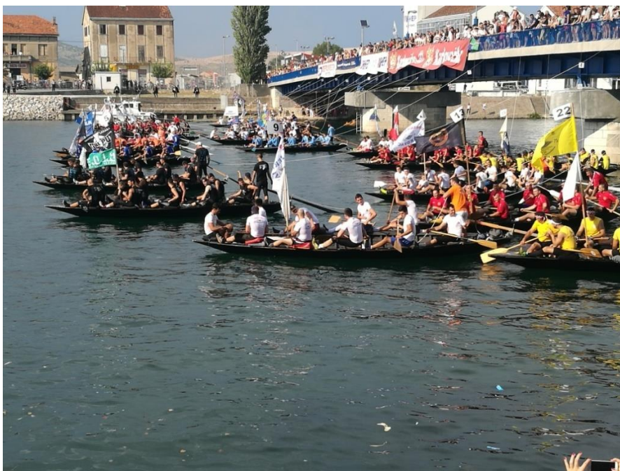
Slikovni prilog 1. Fotografija starta maratona lađa s terenskog istraživanja provedenog 11. kolovoza 2018.

Tada sam bila samo pasivni sudionik koji je slušao povike i komentare navijača te sam uz to naravno i fotografirala i te fotografije ću priložiti u dodatcima uz fotografije koje su mi ustupili sugovornici. Kao što je već navedeno, na maratonu lađa sam bila više puta te sam također koristila utiske i s ostalih maratona, uključujući i ovogodišnji maraton za koji sam vodila bilješke o onome što se pričalo na radiju ali i bilješke o komentarima iza same utrke.