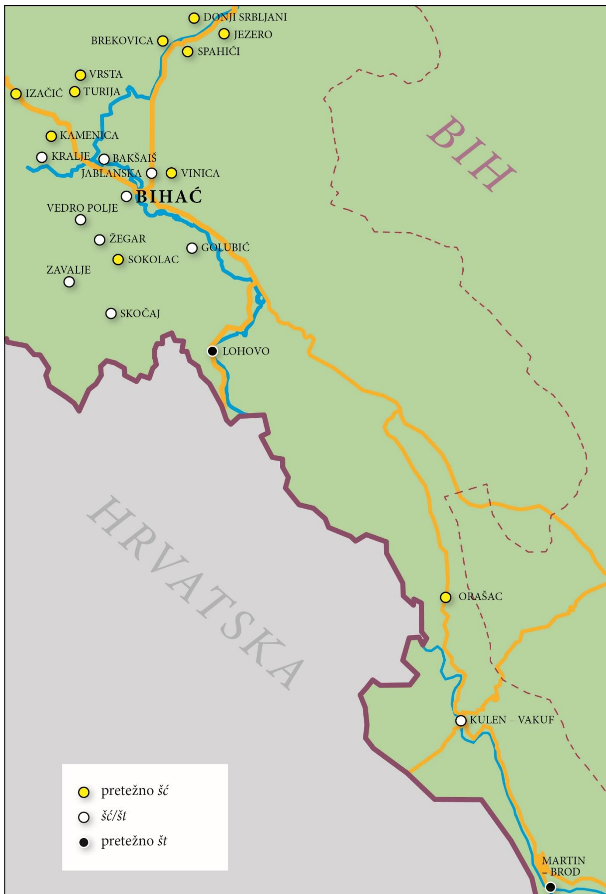
Odnos šć/št u govornima bihačkog područja (karta 2.)