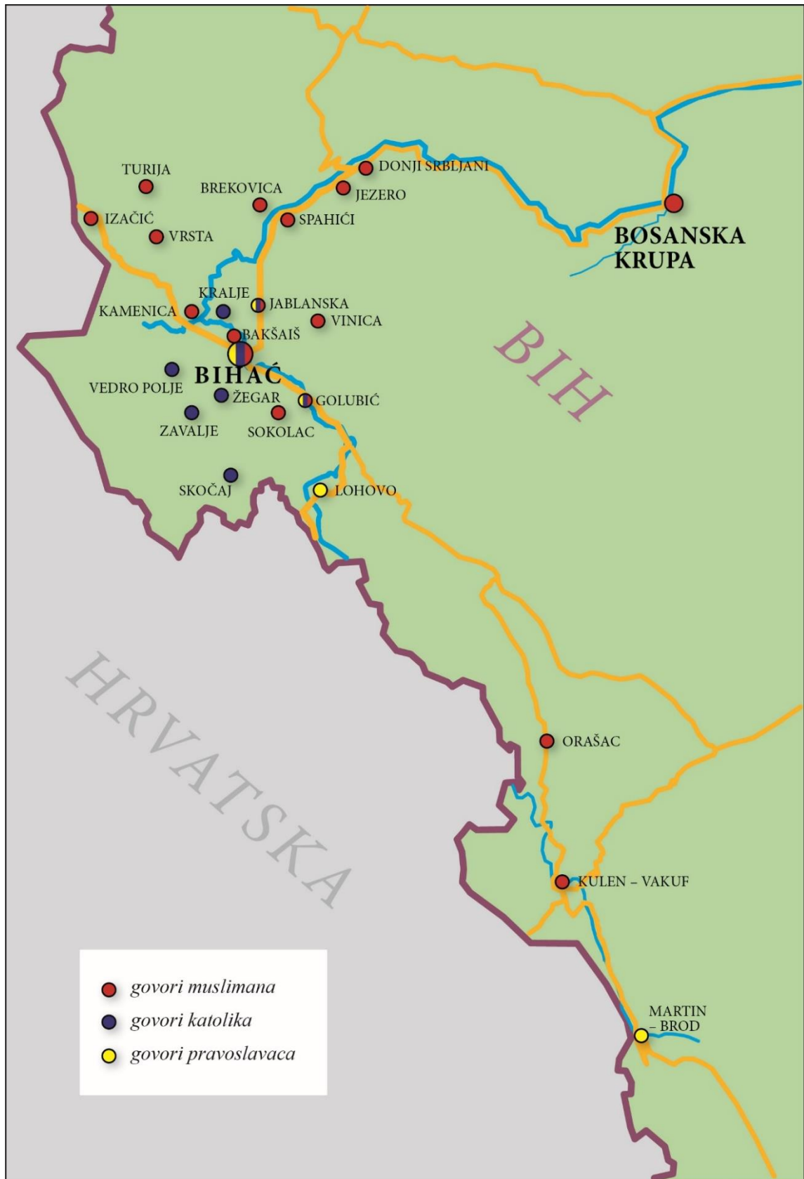
Karta bihaćkog područja i istraživani punktovi (karta 1.)