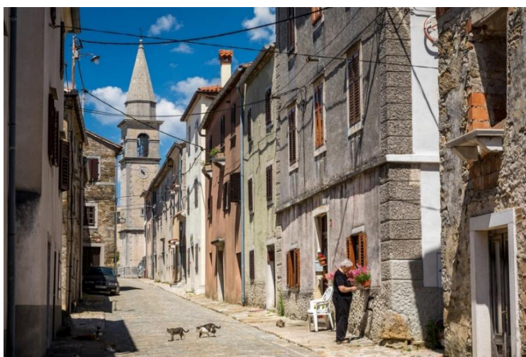
Slika 16. Draguč