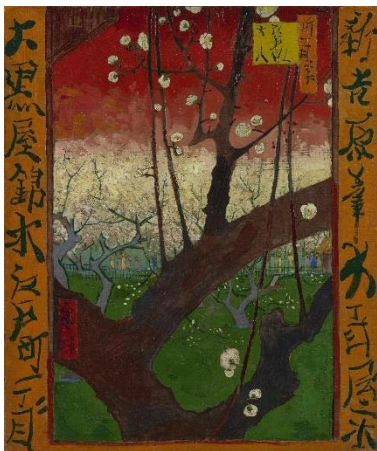
Slika 3 https://www.vangoghmuseum.nl/en/collection/s0115V1962