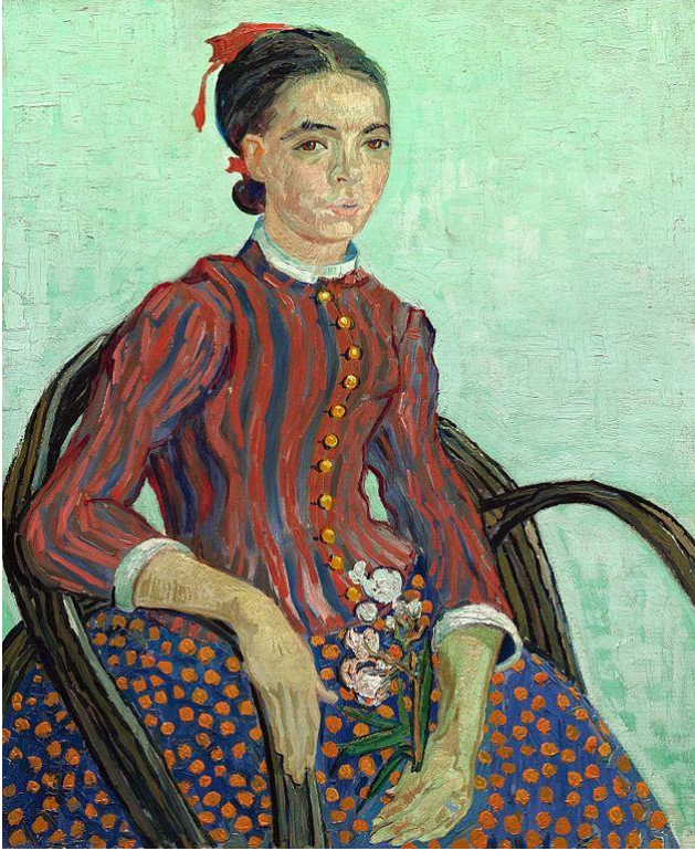
Slika 5 https://commons.wikimedia.org/wiki/File:Vincent_van_Gogh_-_La_Mousm%C3%A9.jpg