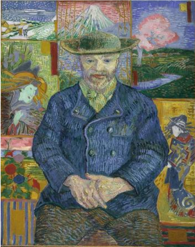
Slika 4 http://www.musee-rodin.fr/en/collections/paintings/pere-tanguy