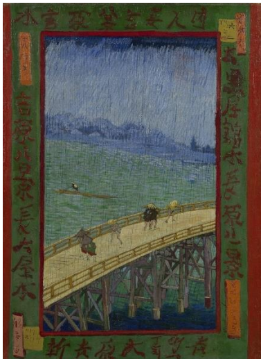
Slika 2 https://www.vangoghmuseum.nl/en/collection/s0114V1962