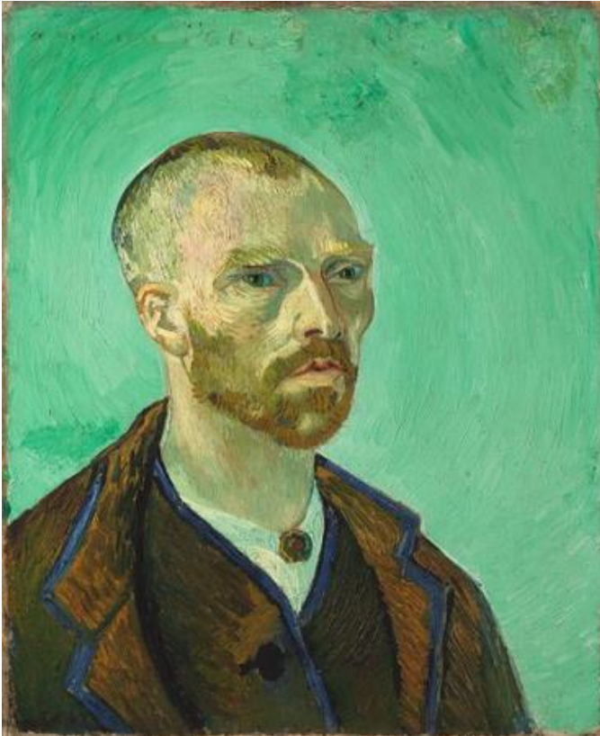
Slika 6 https://smarthistory.org/van-gogh-self-portrait-dedicated-to-paul-gauguin/