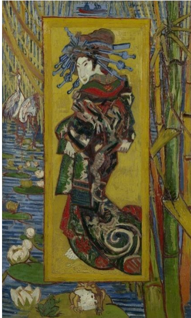
Slika 1 https://www.vangoghmuseum.nl/en/collection/s0116V1962