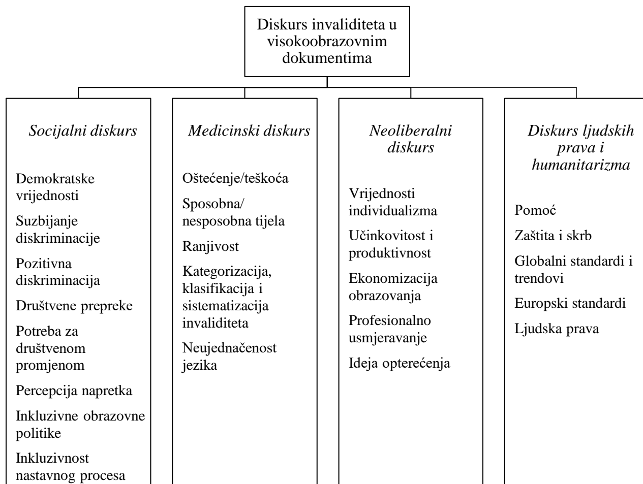
Slika 2. Shematski prikaz elemenata konstrukcije diskursa invaliditeta u visokoobrazovnim dokumentima – diskurzivne teme i kategorije

Ono što se pritom osobito ističe, a dodatno upućuje na „pukotine“ među različitim diskursima, jest u velikoj mjeri neujednačen jezik kojim je invaliditet oblikovan, krećući se od društveno-konstruktivističke terminologije i definicija invaliditeta, do onih koji u potpunosti odražavaju medicinski model deficita. Osobe s invaliditetom se tako navode, osim navedenim pojmom, i „invalidnim“, „tjelesno i duševno oštećenim“, „osobama s posebnim potrebama“ „slabim i nemoćnim“, „osjetljivim“ te „ranjivim“, a navode se i kao „posebna kategorija građana“. Različiti diskursi kombinirani su u jeziku invaliditeta i na razini pojedinog dokumenta, iako određeni dokumenti, u skladu sa sadržajem i kontekstom, imaju tendenciju promocije određenih diskursa, kao što je, s jedne strane Nacionalna strategija izjednačavanja mogućnosti za osobe s invaliditetom od 2017. do 2020. (NN, 42/17) kao dokument koji u najvećoj mjeri poštuva načela idejnog socijalnog modela invaliditeta, i s druge strane, Strategija cjeloživotnog