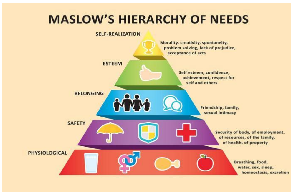
Slika 1. Abraham Maslow – Hijerarhija osnovnih ljudskih potreba (13).

Prikaz hijerarhije u zadovoljavanju osnovnih ljudskih potreba prema Abrahamu Maslowu vidljiv je na slici 1.