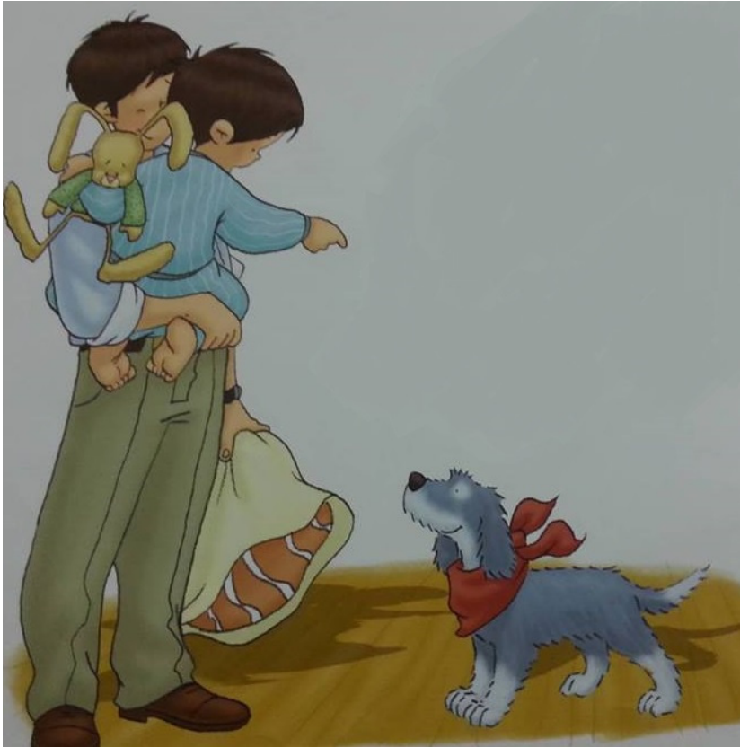
Slika 9: Jakov i tata, ( Jakov se boji mraka , 2013, str 16)

spavati, a Jakov se u međuvremenu uplašio mraka i šuškanja u kući koje nije mogao identificirati, otac je bio taj koji je preuzeo brigu o njemu, pokazao mu da se nema čega bojati, da se to samo pas kreće po kući (Rogeeon, Mazali, 2013). U stresnom trenutku otac je djetetu bio oslonac i utjeha, što daje djetetu potvrdu o pripadanju i sigurnosti, a što mu dalje omogućuje zdrav intelektualni i emocionalni razvoj.