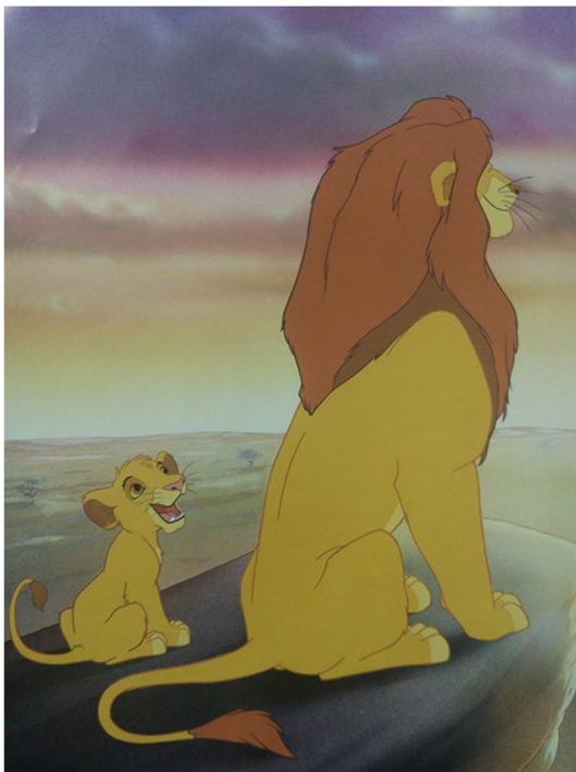
Slika 5: Mufasa poučava Simbu o krugu života, ( Kralj lavova , 2017)

Iako se ne radi direktno na tome, ovdje je prvi put dijete pripremljeno za smrt člana obitelji te razgovorom naučeno kako se to ponekad događa i kako je to normalna stvar. To se vidi u rečenici kada Mufasa svoga sina priprema na to da će i on jednoga dana umrijeti, a da će on sve naslijediti, ali da je takav krug života i da se to treba prihvatiti, a istoj stvari Simba poučava svoje dijete na kraju slikovnice: „Jednom će Simba prenijeti te iste riječi svome sinu... nastavljajući tako neraskidivi krug života.“ (Disney, 2017: 64).