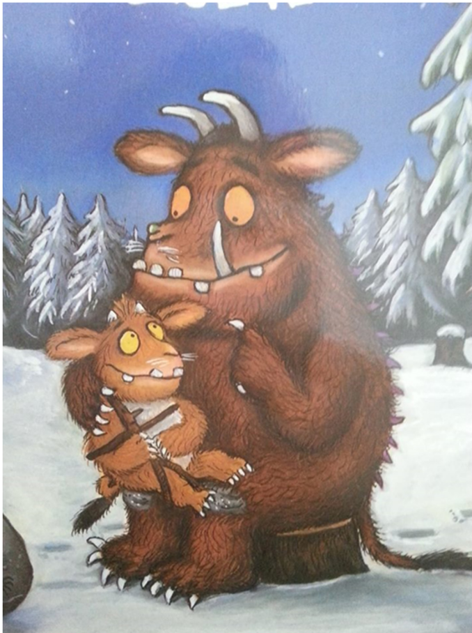
Slika 8: Grubzon i Grubzonica, odgojni akt, ( Grubzonovo dijete , 2005, naslovna stranica)

Grubzonovo dijete je također jedna od suvremenih slikovnica, a glavni likovi su nedefinirana dlakava čudovišta velikih zubi. U toj slikovnici obitelj također nije potpuna, baš kao i u starijim slikovnicama, a glavni likovi su Grubzon, otac i Grubzonica, kći. Radi se o samohranom ocu, a glavni odgajatelj prema tome je otac. Iako je obitelj nepotpuna, ipak daje primjer angažiranog oca, oca koji poučava svoje dijete te provodi svoje vrijeme s njim. Čak koristi i odgojne metode poput verbalne, kada svojoj kćeri objašnjava što i kako treba raditi, odnosno poučava je životu u šumi: „Treba svatko imati na umu da ne stupa mlad u duboku i mračnu šumu... Jer ako to učiniš tebe će zgrabiti Zli Veliki Miš“ (Donaldson, 2005: 2). Važnosti odgoja i prenošenja znanja s roditelja na dijete pridonosi i činjenica da je na prvoj stranici ilustracija djeteta kako sjedi ocu u krilu, a na drugoj odmah verbalna odgojna metoda. Osim što Grubzonicu upozorava kako nitko mlad ne bi trebao ići u šumu, detaljno joj opisuje što bi joj se tamo moglo dogoditi, odnosno koje opasnosti vrebaju iz šume.