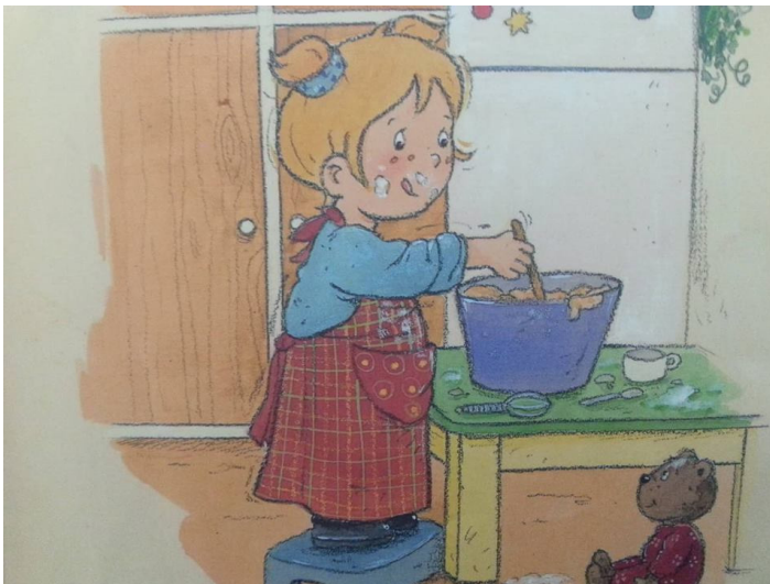
Slika 10: Petra peče kolače ( Petra ne želi posuditi svoje igračke , 2013, str. 11)

Iako je ova slikovnica vrlo koristan didaktički materijal i predstavlja iskorak od starih slikovnica zbog partnerskih odnosa i demokratskog stila, ipak se pojavljuje doza patrijarhalnosti. U slikovnici u ilustracijama, ali i u tekstu majka je prikazana kao ta koja obavlja kućanske poslove: glača i slaže odjeću, a osim toga spominje kako radi kolače zajedno s Petrom. Nadalje, iz ilustracije sa stranice 11. očigledno je kako Petra uči po modelu majke, gledajući nju, ali i uz njene instrukcije pa iako je premala, ona peče kolače. Tu se još jednom vidi koliko je zapravo roditelj model i uzor svome djetetu te kako zbog tog socijalnog učenja, koje se pojavljuje u najranijoj fazi djetinjstva, roditelji moraju najviše paziti na svoje ponašanje. No, osim što je Petra učila po modelu neko ponašanje, ona je u ovom slučaju učila i stereotipnu spolnu ulogu, u kojoj su žene te koje rade kućanske poslove i spadaju u kuhinju.