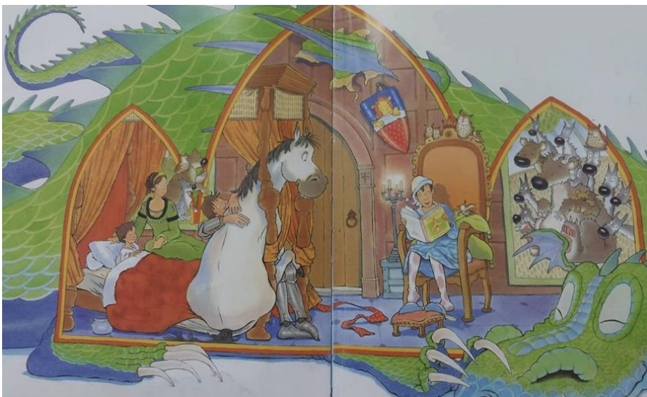
Slika 7: Otac, kralj, koji čita svome djetetu, ženi, vitezu i konju za laku noć ( Kraljevska pusa , 2002)

No, demokratski odnosi i humane vrijednosti koje prenosi otac ne staju ovdje: kako je vitez koji je išao po pusu putem nailazio na brojne nedaće, otac, kralj, odlučio je zajedno svima u sinovljevoj sobi pročitati priču za laku noć. U sobi su se nalazili majka, sin, otac, vitez i njegov konj. Samim primanjem viteza u kraljevićevu intimu i privatni prostor govori o tome kako se kralj odnosi prema podređenima s poštovanjem i uvažavanjem. Upravo se tu radi o humanim vrijednostima koje bi otac odgojem trebao prenositi na svoje dijete. Iako tu vrijednost otac ne prenosi intencionalno, on je prenosi svojim ponašanjem i bivanjem dobrim uzorom svome sinu, a svjesni smo kako djeca u vrlo ranoj dobi uče po modelu, odnosno oponašaju svoje roditelje, posebno one istoga spola/roda. Osim toga, otac je shvatio kako mora mijenjati temelje svoga očinstva jer vidi da to uzrujava njegova sina, on je odlučio da nikada više neće biti u žurbi, nego će imati vremena za svoju obitelj. To je potvrdio čitanjem svima za laku noć, a time je i promaknuo vrijednost provođenjem vremena sa svojom obitelji. „Te je noći kraljević bio sretan, i kraljica je bila sretna, a kralj je obećao da će prestati uvijek biti u žurbi.“ (Melling, 2002: 25).