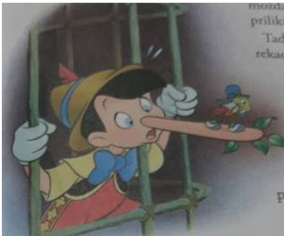
Slika 2: Kazna koja je snašla Pinokija, ( Pinokio , 2011)

odgajatelj u obitelji. Jako je želio i volio svoga sina, a veliku je pažnju posvećivao odgoju i obrazovanju. Želio je da njegov sin Pinokio bude pametan kao i druga djeca: „Danas ćeš krenuti u školu kako bi postao pametan poput druge djece.“ (Busquers, 2011: 8). No zanimljivost u ovoj slikovnici čini i odgojna djelatnost jednog lika koji nije dio obitelji, ali je omogućio život Pinokiju – Vila. Vila predstavlja prototip majke koja je brinula o moralnom odgoju Pinokija, a vrijednosti koje je ona zahtijevala od njega bile su hrabrost, poštenje i dobrota (Busquers, 2011). Odgojne metode koje je koristila bile su uvjetovanje: da bi Pinokio postao pravi dječak morao je biti dobar, pošten i hrabar, a kada bi odstupao od zadanoga, Vila bi se koristila zadavanjem kazne kako bi otklonila nepoželjno ponašanje: kada bi Pinokio lagao, njegov nos bi rastao. Tu se radi o operantnom uvjetovanju poznato u psihologiji kao jedan od načina učenja.