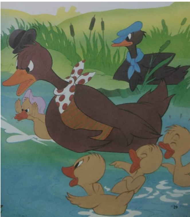
Slika 1: Prikaz obitelji iz slikovnice Ružno pače (1994), 29. str.

Osim tog oblika obitelji, koji predstavlja glavne likove u ovoj priči, na ilustraciji u slikovnici na 29. str. pojavljuje se još jedna obitelj pataka koja je ovaj put potpuna, a sastoji se od majke patke označena bijelo crvenom maramom oko vrata, dok je otac prikazan u pozadini, kao pasivan u dječjoj okolini s plavom kapom i maramom oko vrata. Ta obitelj imala je i tri sina čiji spol nije bio nikako označen, ali je prepoznat po tome što su imali sestru koja je nosila roza kapicu na glavi. Čak i u ovoj situaciji, gdje je na ilustraciji prikazana potpuna obitelj majka se čini kao primarna odgajateljica, jer je prikazana u blizini djece te komunicira s Ružnim pačetom kojeg je tada možda smatrala prijatnjom za njenu djecu, dok je otac pasivan u pozadini.