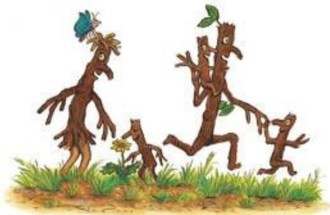
Slika 6. Prutimir i njegova obitelj u igri, ( Prutimir , 2004, str 1)

Ono po čemu je ova slikovnica jako značajna jest to da se po prvi puta vide partnerski odnosi između majke i oca, odnosno muškarca i žene. Iako nigdje nije direktno napisano kako se odvija odgoj djece ili tko je glavni odgajatelj, iz ilustracija se vidi kako su i majka i otac zajedno u odgoju svoje djece te kako svoje slobodno vrijeme provode u igri s njima. Po tome se da zaključiti i kako je njihov roditeljski stil demokratski, jer se djeca ne čine sputano, a niti previše razmaženo. Upravo zbog toga imaju priliku izrasti u potpunu zdravu ličnost. Zbog toga se ne može govoriti o primarnom i sekundarnom odgajatelju.