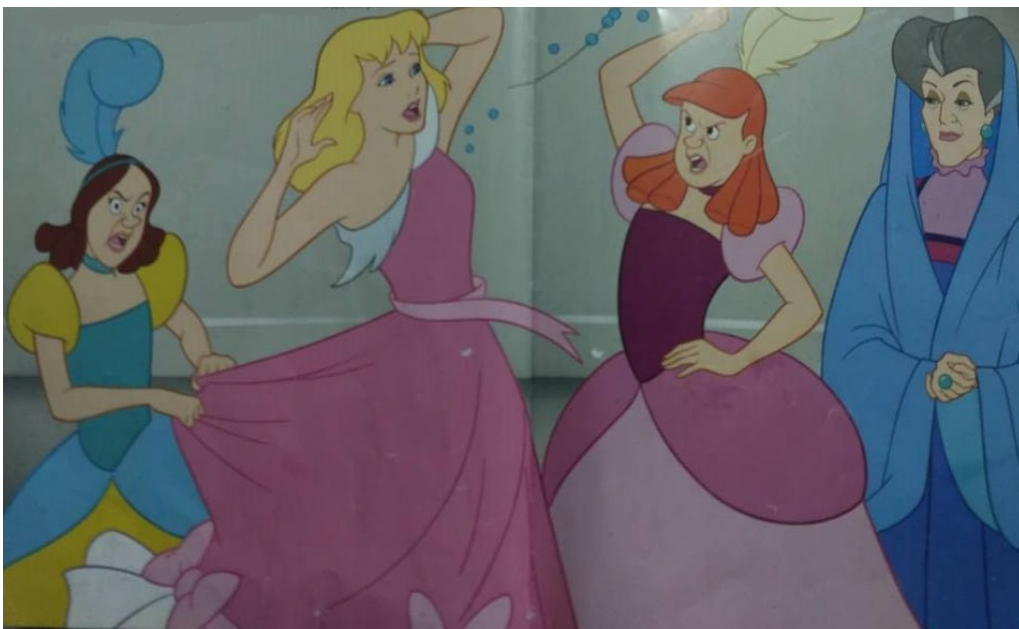
Slika 4: Pepeljuga s polusestrama i maćehom, ( Pepeljuga , 2008)

Kada je u pitanju odgojni stil maćehe prema svojim kćerima je ili permisivan ili demokratski. Majka pruža previše ljubavi i odobravanja, dok kćeri rade što žele uz majčinu podršku. No, kada je u pitanju odnos prema Pepeljugi, može se reći kako je puno stroži, a ljubav uopće ne postoji. Takav odgojni stil maćehe je autoritaran i takav odgojni stil nije podoban po djecu jer se iz njih može razviti agresivno dijete, nerazvijene ličnosti koje žudi za roditeljevom ljubavi. Tome u prilog idu i rezultati istraživanja Kurtović i Marčinko (2010) koji govore o snažnoj povezanosti između negativnog majčinstva i depresivnosti djeteta, odnosno emocionalna zakinutost majke služi kao najjači prediktor depresivnosti. „Izgleda da su ponašanja majki koja uključuju odbijanje, oštru disciplinu i manipulaciju osjećajima djeteta, osobito nepovoljna za mentalno zdravlje adolescenata“ (Kurtović, Marčinko, 2010: 35), a takva ponašanja se upravo pojavljuju kod Pepeljuginje maćehe. Može se reći kako maćeha zanemaruje prvo načelo roditeljskog odgoja, a to je poštovanje dječje osobnosti pomoću koje bi dijete trebalo razviti svoju osobnost, a nastaje uvažavanjem djeteta i poštivanjem njegova dostojanstva (Rosić, 1998), dok je Pepeljuga izložena vrijeđanju i iskorištavanju. Ono što se od odgojnih načela ostvaruje kod maćehe je, nažalost, dosljednost u njenom zlostavljanju i zanemarivanju Pepeljuge, a tetošenja kod bioloških kćeri.