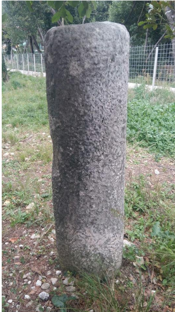
Slika 1. Stup u Podmorju/Dilatu (fotografirano: 27. 12. 2017.)