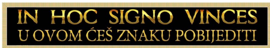
Slika 3 Moto 4. gardijske brigade ( URL 3 )