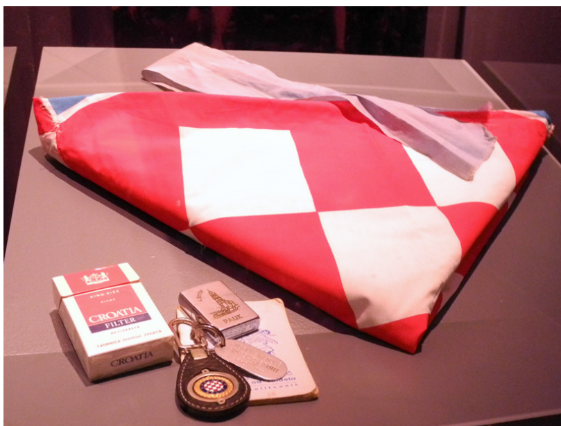
Slika 14 Paukovi osobni predmeti u Hrvatskom povijesnom muzeju ( URL 16 )

“Nema te vojske koju Pauk nije mogao poraziti.” Pred akciju Južni potez „Pauk” je s mnogo gelera po svom tijelu govorio svim suborcima da više nema snage za ratovanje. Predao je dokumentaciju za odlazak u mirovinu te je s radošću mnogo puta ponavljao da uskoro ide “na masline i slane srdele”. Nije doživio toliko željenu i zasluženu mirovinu i stoga još više zaslužuje da mu čitavi Hrvatski narod zauvijek bude neizmjereno zahvalan. 34