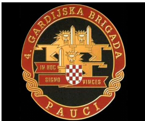
Slika 4 Grb 4. gardijske brigade ( URL 4 )

Zadar, "Kruševo", "Zelene Table – Male Bare", "Šibenik", Vrljika, "Drniš", Ston, "Dubrovnik", Ljeto, "Maslenica", Maestral, "Oluja", "Južni Potez"... Gradovi su to te akcije tijekom kojih su Pauci oslobađali svoju zemlju okupiranu od strane srbo – četničkih agresora. 8