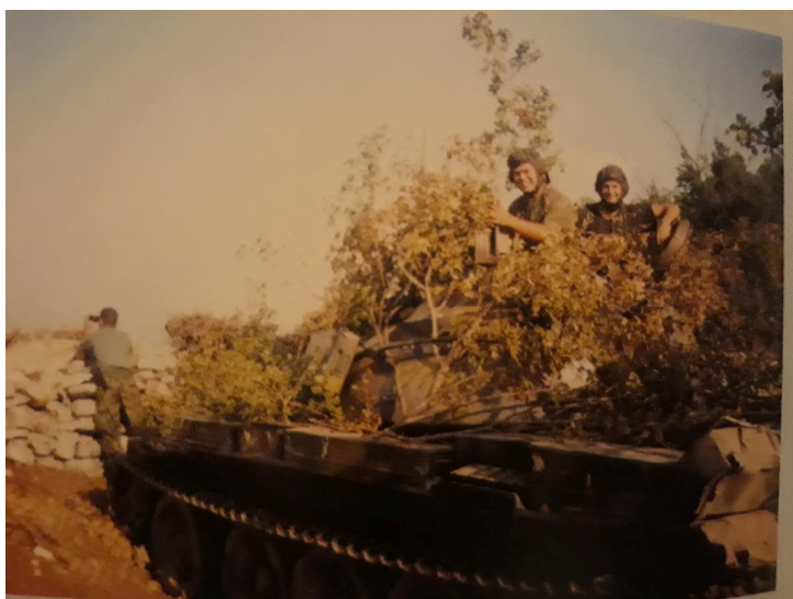
Slika 5 „Paukov“ tenk na položaju iznad grada Dubrovnika, ratna 1992.

vojnih snaga vraćala oduzete hrvatske teritorije. Neprijatelji su se okuražili u početnim pobjedama i naoružanjem te su donosili niz deklaracija od Prijedora preko Banje Luke do Beograda za ujedinjenje svih srpskih zemalja. Hrvatskoj je predsjednik Tuđman prisvojio međunarodno priznanje i članstvo UN-a. Hrvatska vojska ubrzo je izvela jednu operaciju pod nazivom „Miljevci“ u šibenskom zaleđu, a kasnije je uslijedio niz drugih operacija HV i HVO na južnom bojištu koje su dovele do oslobađanja Dubrovnika i cijelog juga Hrvatske. U ovim izrazito važnim političkim potezima zbilja se i prva Paukova bravura u dubrovačkim brdima kada je tenkove povukao starom željeznicom za Trebinje i tako stao neprijateljima iza leđa koji su ostali zabezeknuti. Taj manvear se odvio u bitkama za mjesta „Zaplatnik“, „Ivanjicu“ i „Uskoplje”. 13