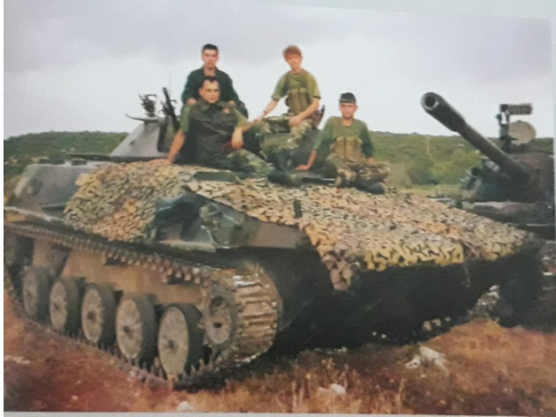
Slika 7 Bojna posada tenka, ratna 1993. ( IZVOR 9 )

Nakon što je mjesto zapovjednika prepustio mlađim vojnicima Pauk postaje načelnik oklopnih snaga 4. gardijske brigade , a ubrzo je preuzeo mjesto načelnika stožera. Vrlo bitno za napomenuti jest, da je Pauk nakon što je ranjen Damir Krstičević preuzeo vodstvo operacije Zima 94', njom se pripremao teren za „Oluju”. 16