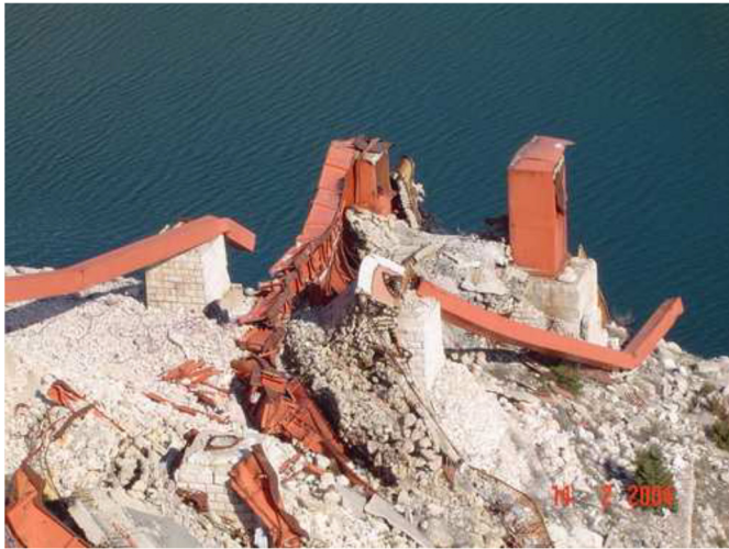
Slika 6 Srušeni Maslenički most 21. studenog 1991. ( URL 8 )

„Maslenica“ gdje je odnio pobjedu nad tenkovima JNA, to je ujedno i dokaz zašto je dobio nadimak „čovjek oklopnjak“. 14