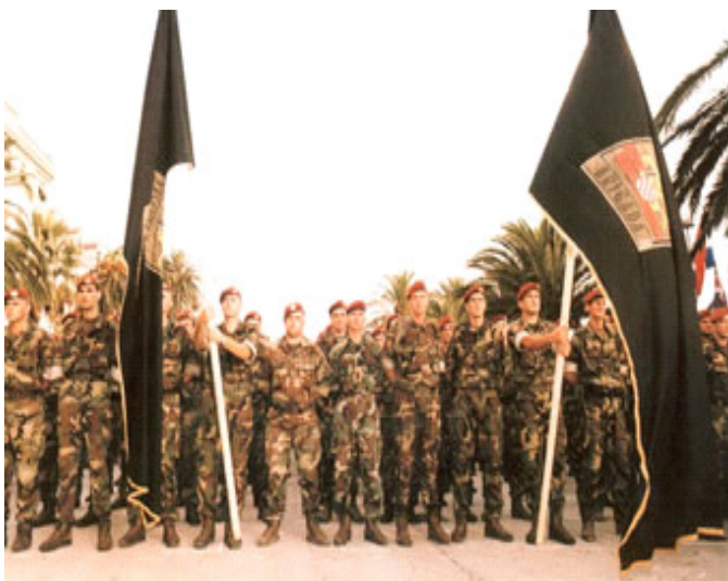
Slika 5 Postrojavanje 4. gardijske brigade na splitskoj rivi prilikom osnutka ( URL 5 )

U Domovinskom ratu brigada je izgubila 195 svojih pripadnika, a 5 gardista se i dalje vodi nestalima te se za njima traga i nisu zaboravljeni jer svaki čovjek koji je položio život za ovu domovinu zaslužuje svoje mjesto na kojem mu se svi možemo pokloniti. Oko 1600 pripadnika brigade je u ratu makar jednom bilo ranjeno od metka sto je jako velika brojka, no srećom preživjeli su i nastavili su živjeti s ponosom i srećom zbog izborene slobode. Kroz nju je prošlo mnogo iznimnih boraca, dočasnika i časnika koji su danas u mirovini ili na važnim dužnostima. Svi oni su stavljanjem svog života na raspolaganje domovini učinili da ime 4. gardijske brigade postane nezaobilazno u stvaranju novije hrvatske povijesti. 11