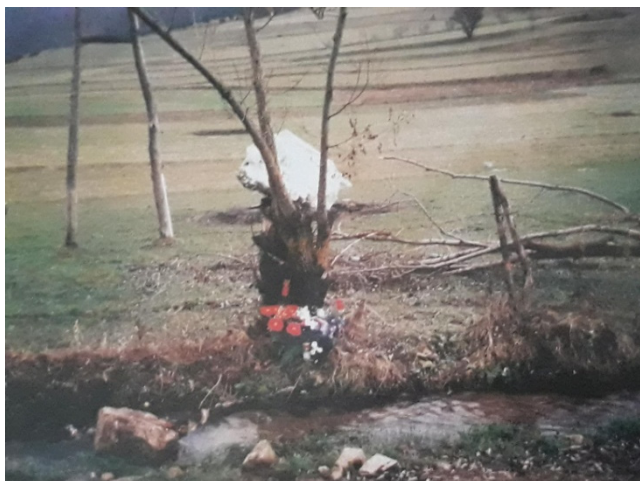
Slika 10 Mjesto pogibije Andrije Matijaša - Pauka

Četvrta je dobila novi zadatak u akciji znanj kao “Južni potez” s ciljem da se oslobodi prostor Mrkonjić Grada s okolicom. Hrvatska vojska je na čelu s “Četvrtom” dana 9. listopada 1995. obavila snažnu tenkovski napad koji je predvodio sam Andrija i do konca istog dana dovršen je najkompleksniji zadatak akcije. Neprijateljske snage su u cijelosti potučene te prisiljene na veliki bijeg. Taj dan bi zasigurno ostao upamćen kao genijalna demonstracija organizacije i moći “Hrvatske Vojske”, no oskvrnut je pogibijom legendarnog domoljuba i velikog heroja 4. gardijske, general - bojnika Andrije Matijaša – “Pauka”. 21