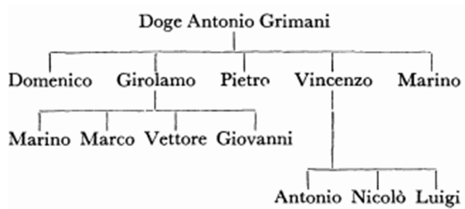
Slika 1 Obiteljsko stablo Grimani (izvor: MARILYN PERRY 1978., 217.)