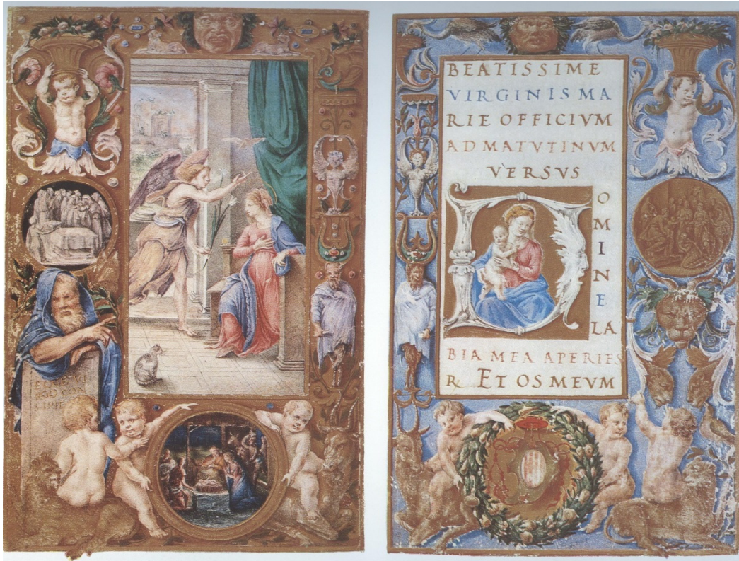
Slika 7 Časoslov Stuart de Rothesay, fol. 13v Navještenje i fol. 14r Bogorodica s Djetetom (izvor: MARIA CIONINI VISANI, 1977., 30.)