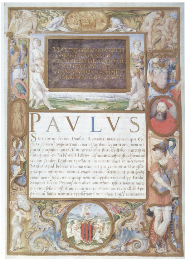
Slika 12 Komentar kardinala Marina Grimanija uz poslanice Sv. Pavla apostola, fol. 9r