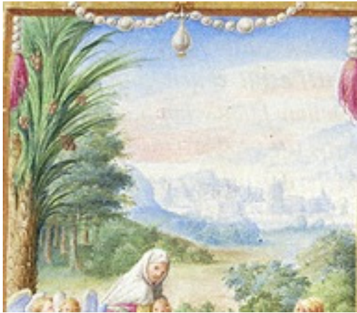
Slika 15 Časoslov Farnese, detalj fol.42v Bijeg u Egipat