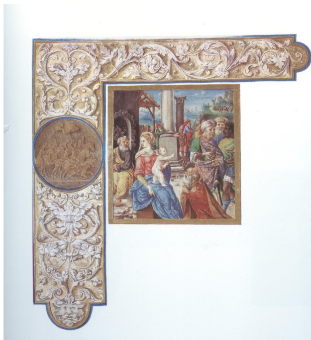
Slika 4 Evangelistar Grimani fol. 10v Poklonstvo kraljeva