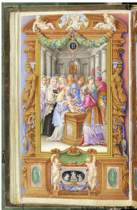
Slika 17 Časoslov Farnese, fol. 34v