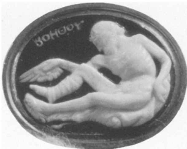
Slika 2 Antička kameja, Filoktet