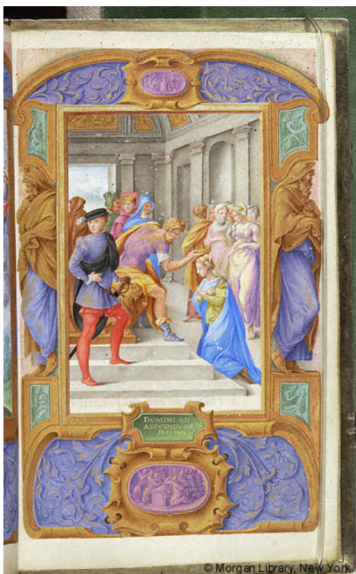
Slika 18 Časoslov Farnese, fol. 49r