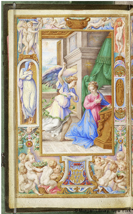
Slika 19 Časoslov Farnese, fol 4v Navještenje