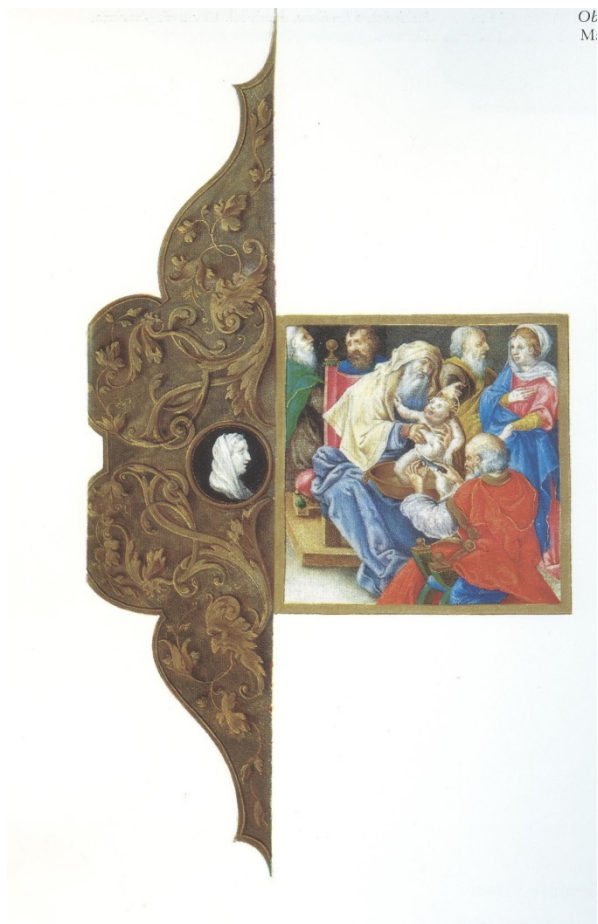
Slika 3 Evangelistar Grimani fol. 9r Obrezanje