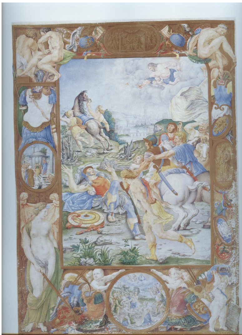
Slika 9 Komentar kardinala Marina Grimanija uz poslanice Sv. Pavla apostola, fol. 8v Obraćenje sv. Pavla (izvor: MARIA CIONINI VISANI, 1977., 37.)