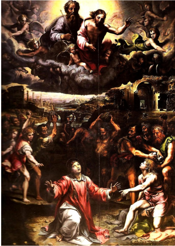
Slika 10 Giulio Romano, Kamenovanje sv. Stjepana , (izvor: https://genovacittasegreta.files.wordpress.com/2015/11/giulio-romano.jpg )