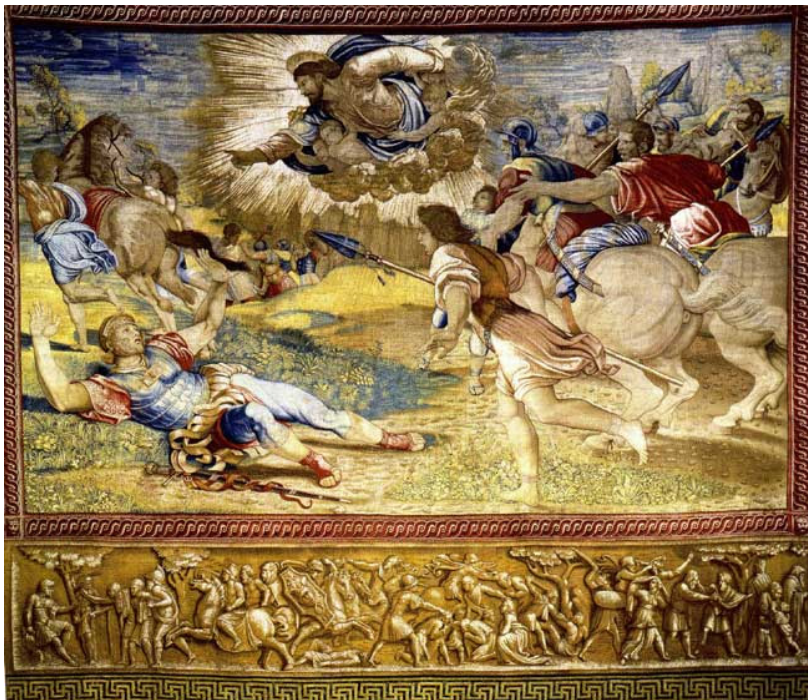
Slika 11 Tapiserija Preobraćenje sv. Pavla po Rafaelovu predlošku, Vatikanski muzej