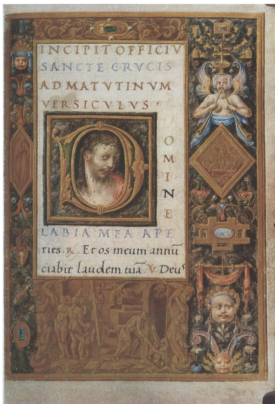
Slika 5 Časoslov Stuart de Rothesay, fol.166r