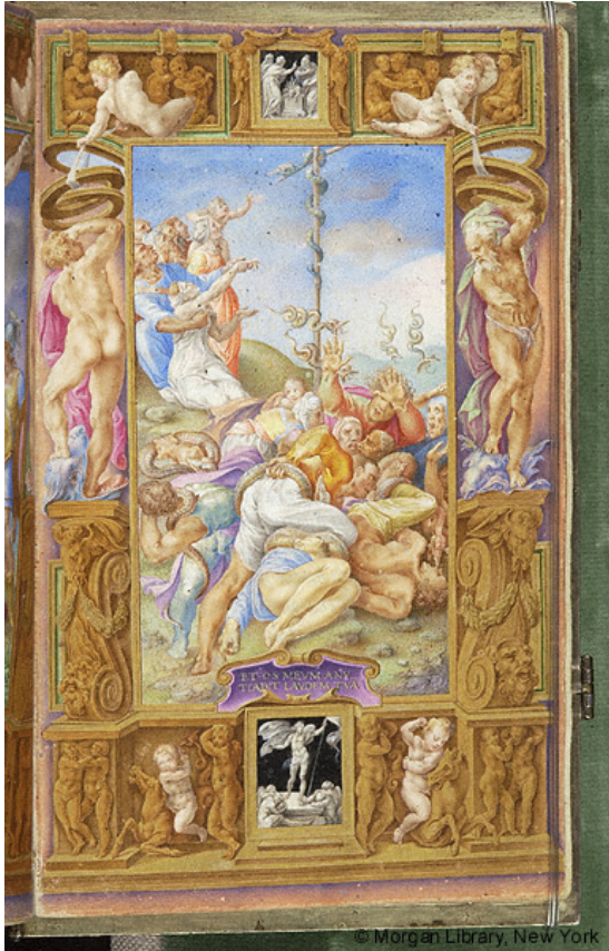
Slika 13 Časoslov Farnese, fol 103r Brončana zmija