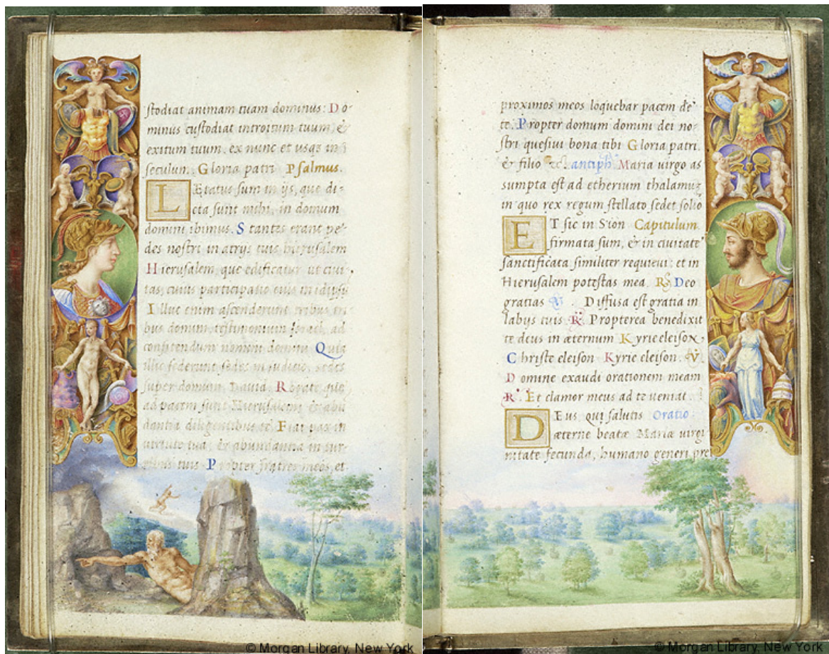
Slika 16 Časoslov Farnese, fol. 32v i 33r