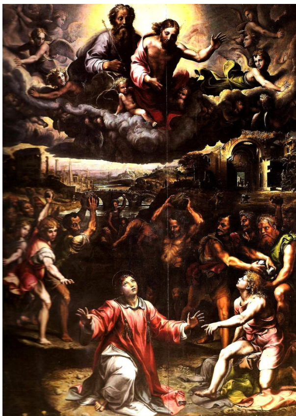
Slika 10 Giulio Romano, Kamenovanje sv. Stjepana , (izvor: https://genovacittasegreta.files.wordpress.com/2015/11/giulio-romano.jpg )