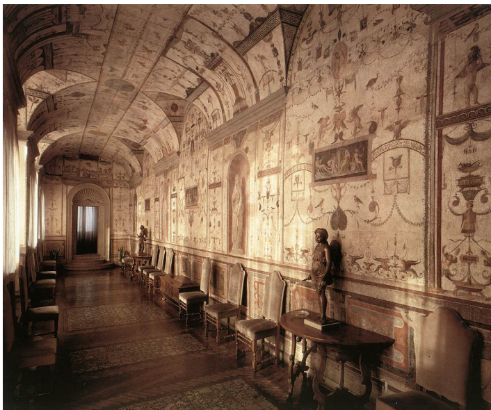
Slika 8 Rafael i Giovanni da Udine, Loggietta kardinala Bibiene, Vatikanska palača