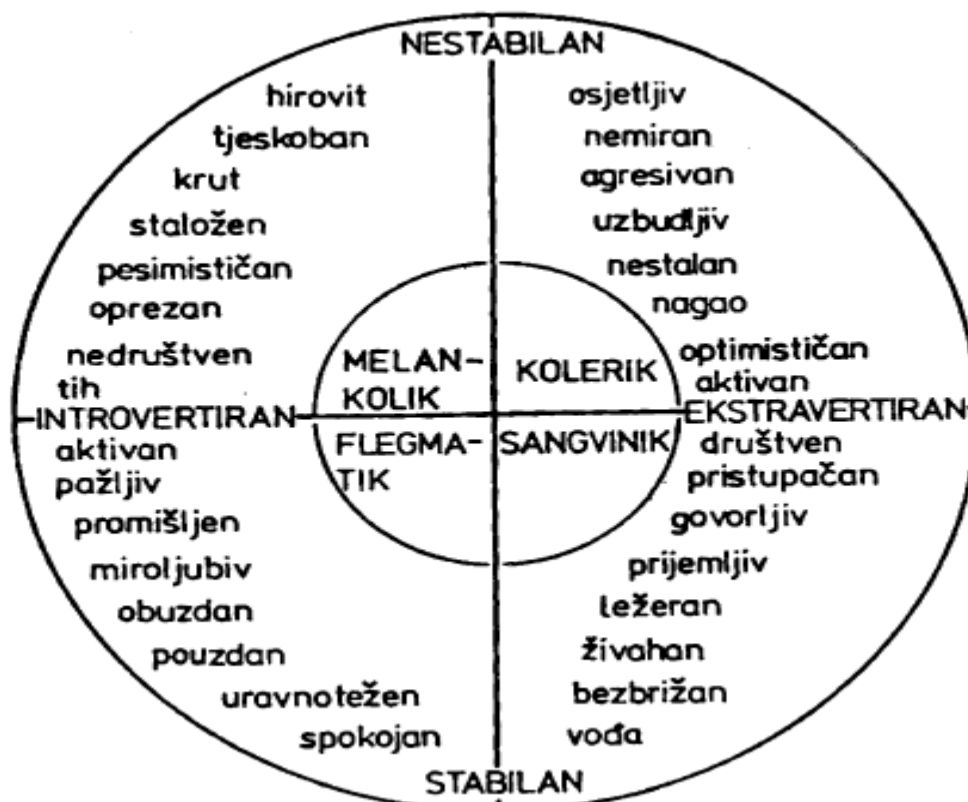
Slika 1 Prikaz odnosa Eysenkove dvodimenzionalne teorije ličnosti i Hipokrat-Galenove tipologije temperamenta (preuzeto od Fulgosi, 1997).

shizoidnosti i psihotičnosti (Slika 2). Osoba se u ovom slučaju može nalaziti na bilo kojem dijelu kontinuuma, ovisno o stupnju izraženosti određene crte ličnosti (Repišti, 2016).