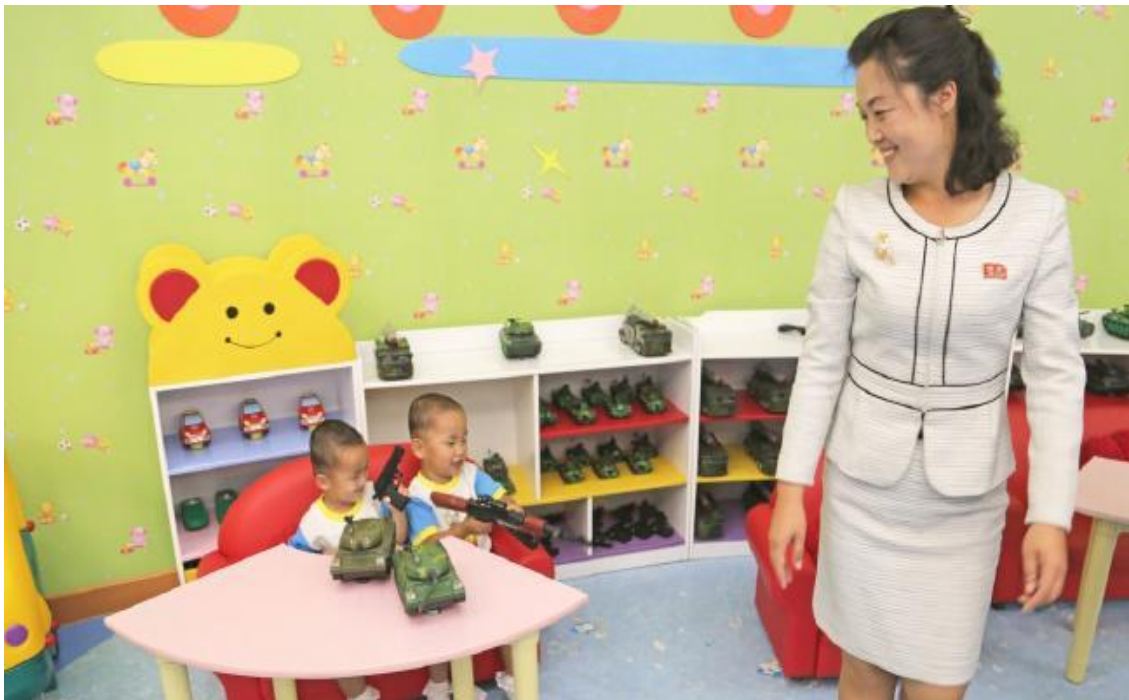
Slika 13. Sjevernokorejski vrtić