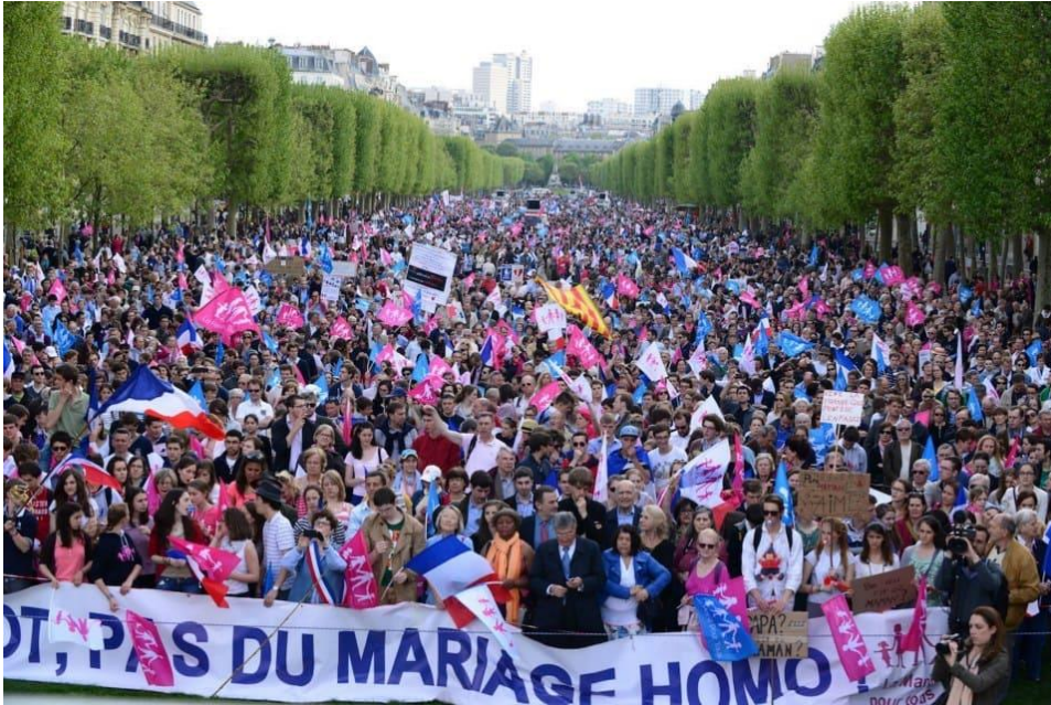
Slika 19. Prosvjed milijuna Francuza za zaštitu tradicionalnih vrijednosti (2013.)