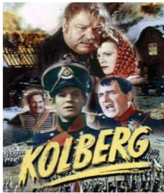
Slika 8. Poster filma Kolberg (1945.)

Izvor: http://militaryhistorynow.com/2015/04/29/kolberg-the-third-reichs-cinematic-swan-song (23.10.2017.)