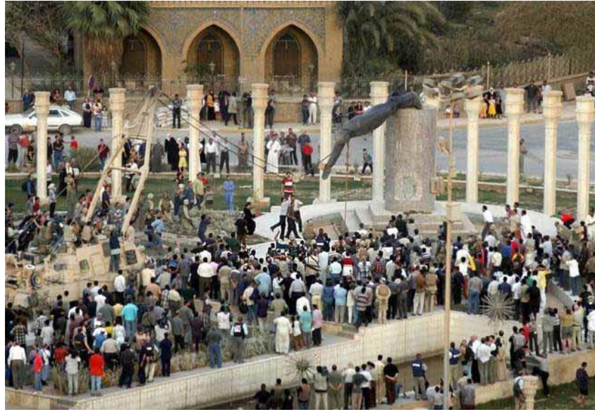
Slika 14. Rušenje Saddamovog kipa (2003.)