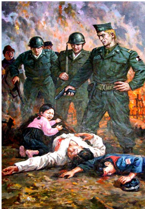
Slika 10. Primjer sjevernokorejske propagande (Korejski rat) (2)