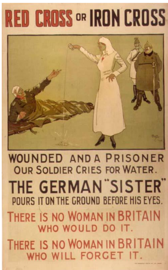
Slika 6. “Crveni križ ili željezni križ“