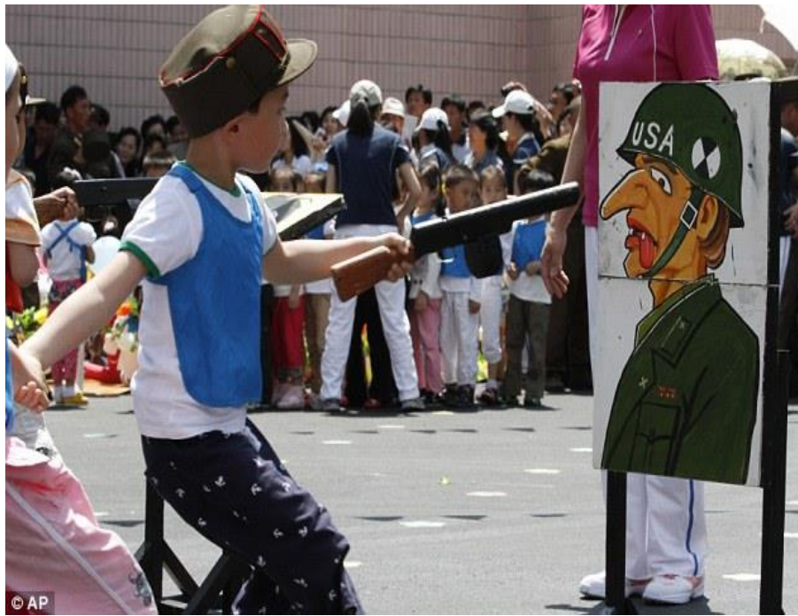
Slika 12. Edukacija djece u ranoj dobi (praktični dio)