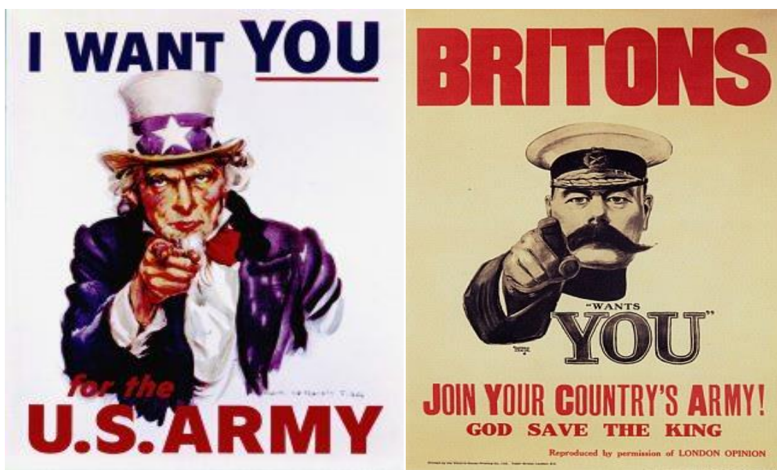
Slika 5. “Lord Kitchener vas treba“ (1914.)

Izvori: https://www.washingtonpost.com/news/morning-mix/wp/2017/04/03/the-uncle-sam-i-want-you-poster-is-100-years-old-almost-everything-about-it-was-borrowed/?utm_term=.b2797e81abba (23.10.2017.) i http://www.dailymail.co.uk/news/article-3625322/Killed-Winston-Churchill-escape-new-life-Stalin-Death-World-War-poster-icon-Lord-Kitchener-shrouded-conspiracy-theories-100-years-died.html