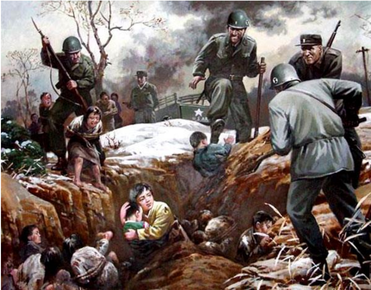
Slika 9. Primjer sjevernokorejske propagande (Korejski rat) (1)