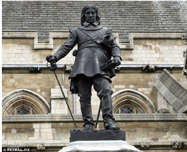
Bild 2: Oliver Cromwell's Statue außerhalb des Parliamentshauses in Westminster, London

ein jüdisches Vorhaben ist. Oliver Cromwell (Bild 2) war der erste der auf diese Idee kam, und seine theologischen Nachfolger in Britannien und den Vereinigten Staaten haben die Idee (sehr erfolgreich) weitergetragen, weswegen er rechtlich als der Vorvater der zionistischen Bewegung beschrieben sein sollte. Die Bewegung die er gegründet hat, und seine Nachfolger weitergetragen haben, ist heute als christliches Zionismus 6 bekannt.