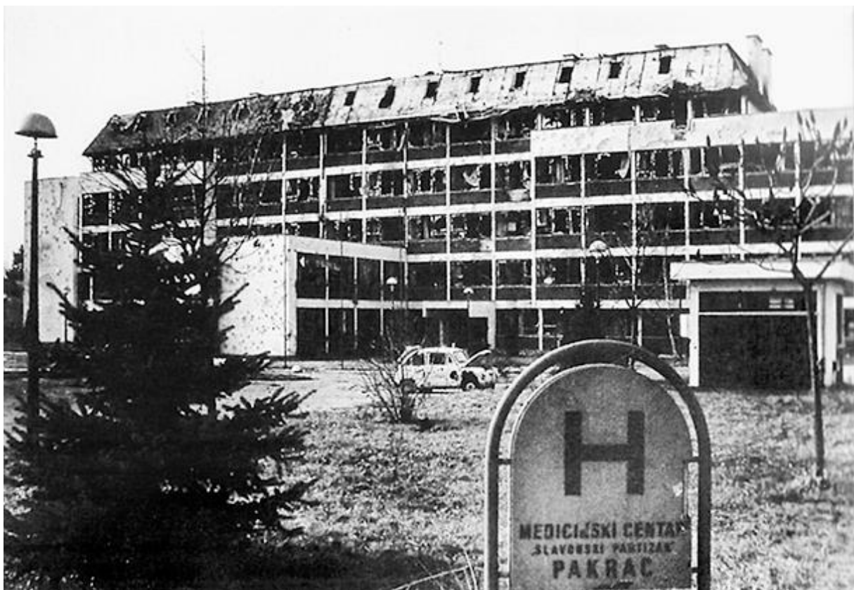
Slika3. Bolnica u Pakracu, jesen–zima 1991.

Slika 3. Prikazuje uništenu bolnicu u Pakracu. Malo prije totalnog uništenja bolnice pod neprestanom agresorskom paljbom organizirano su izvedeni pacijenti iz bolnice. U evakuaciji bolnice sudjelovali su vozači sa šest Čazmatrans autobusa te hrvatska vojska sa oklopnim vozilima. Vukovarska bolnica npr. svakodnevno je bila namjerno granatirana sa 70-80 projektila dnevno. Unatoč nemogućim uvjetima rada u bolnici je zbrinuto je oko 3 500 stradalih vojnika i civila te je izvedeno više od 2 500 operativnih zahvata. Na kraju je bolnica uništena a u padu grada pacijenti i osoblje su bili izloženi genocidnim radnjama pobunjenih i naoružanih Srba. Uništena je bolnica u Vinkovcima, Slavonskom Brodu (7).