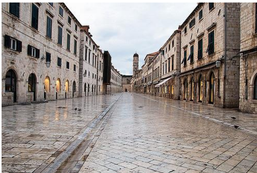
Prilog 5: glavna gradska ulica Placa (pogled s istoka)