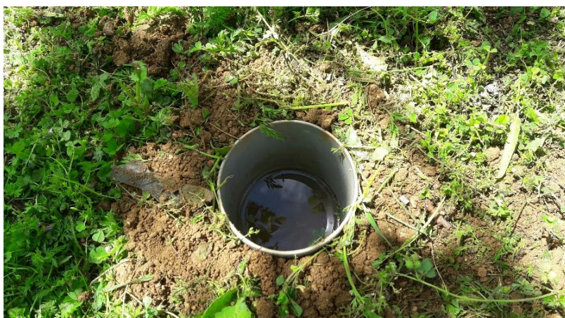
Slika 2. Lovne posude (pitfall traps)

do jedne trećine i u svaku je dodano 50 ml alkohola (70 %-tni etanol). Otresanje grana je provedeno pomoću entomološke mreže promjera 40 cm na 33 nasumično odabranih grana stabala iz svakog dijela nasada. Postupak otresanja se provodi sa 3 snažna i brza udarca što uzrokuje padanje kukaca u mrežu. Uzorkovanje lovnim posudama je obavljeno 3 puta mjesečno, otresanje grana je provedeno 2 puta mjesečno, dok su žute ploče pregledavane svakih 7 dana. Pokus je trajao 4 mjeseca (svibanj-kolovoz). Skupljeni uzorci su čuvani u zamrzivaču na temperaturi 0 °C. Svi uzorci su zatim pregledani pod binokularnom lupom i determinirani do razine reda, a gdje je moguće i do porodice. Determinacija je obavljena pomoću entomoloških ključeva (Schmidt, 1970.)