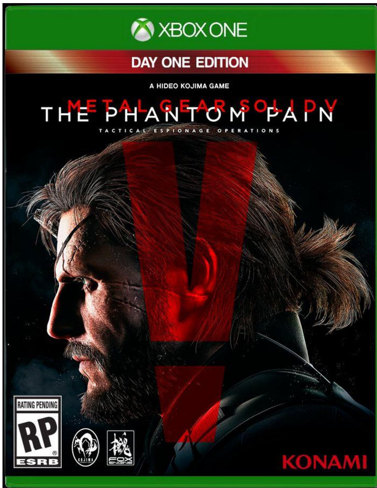
Slika 1. Prednja strana kutije za videoigru „Metal Gear Solid 5: The Phantom Pain: tactical espionage operations“ 8