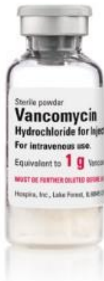
Slika 3. Vankomicin