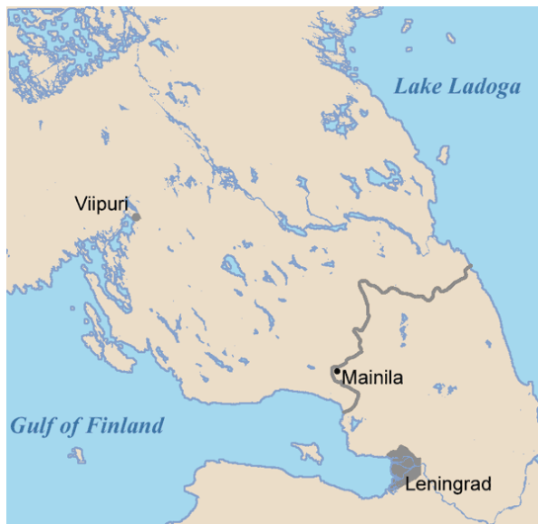
Slika 2. Položaj sela Mainila pred početak Zimskog rata ( URL 2. )