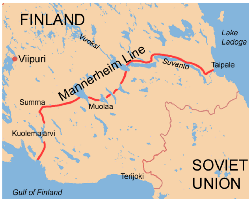
Slika 3. Mannerheimova obrambena linija ( URL 3 )

Za paniku u finskim redovima najviše su bili zaslužni sovjetski tenkovi. Naime, većina finske vojske nikad nije vidjela tenk. Iako su sovjetski tenkovi na početku ofenzive imali jednostavnu taktiku frontalnog napada, ipak su ostavili psihološki učinak. Tri dana nakon konfrontacije s tenkovima, 4. studenog 1939. godine, finska je vojska počela pružati jači otpor. Uvidjeli su da se protiv sovjetskih tenkova može lako boriti. Stavljajući klade među gusjenice tenkova uspjeli su onesposobiti tenkove. Osim klada, Finci su koristili molotovljev koktel i improviziranu granatu, koja se sastojala od više spojenih granata omotanih samoljepljivom trakom. Smrtnost vojnika koji su išli na lov na tenkove bila je velika, u nekim jedinicama čak i 70%. Čak je 80 sovjetskih tenkova uništeno prije dolaska na Mannerheimovu liniju. Iako Finska nije izvojevala pobjedu, nanijela je Sovjetima veliku štetu. Između 3. i 6. prosinca 1939. godine, finske snage koje su se nalazile između Mannerheimove linije i državne granice povukle su se na glavnu crtu obrane, Mannerheimovu liniju. Sovjetska vojska 6. prosinca dolazi pred Mannerheimovu liniju i pokreće prve napade koji su rezultirali katastrofalnim gubitcima. Početni