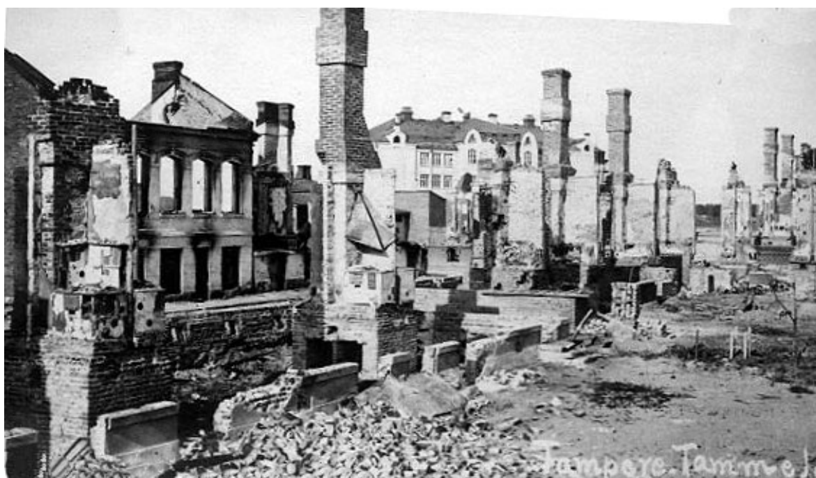
Slika 1. Grad Tampere uništen u građanskom ratu ( URL 1.)