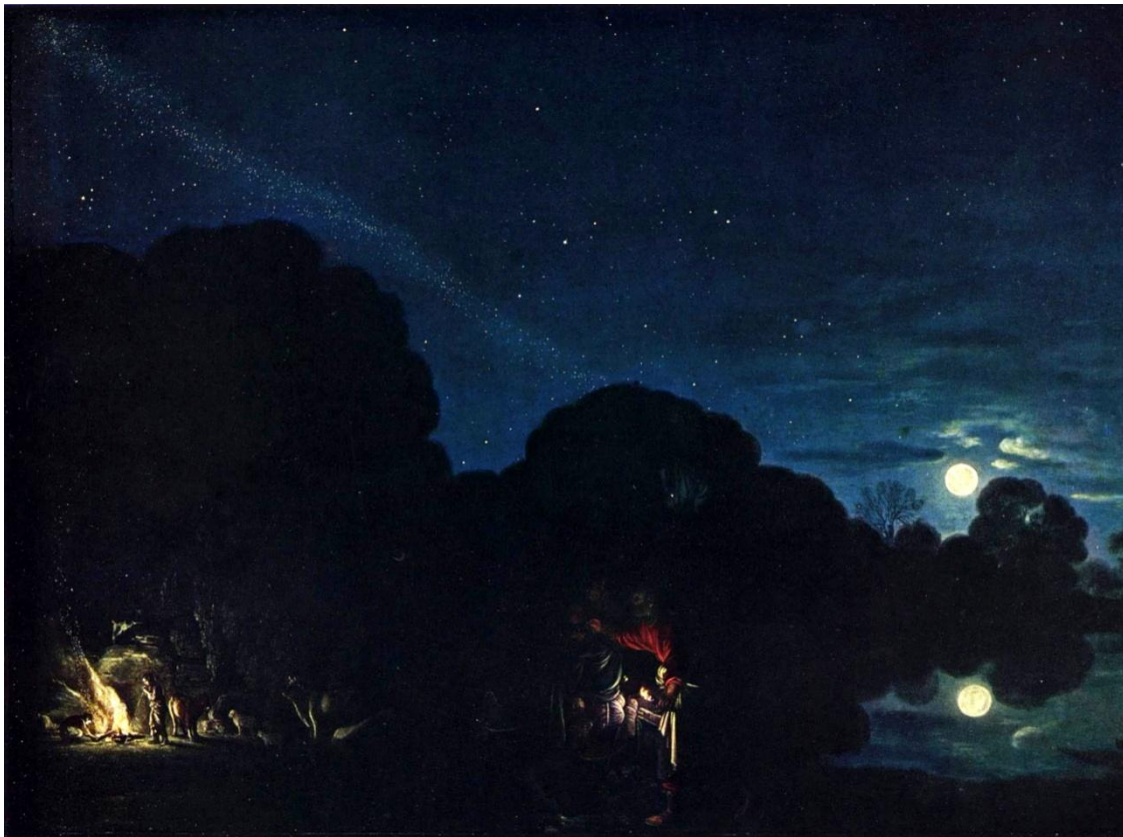
Slika 1 „Bijeg u Egipat“