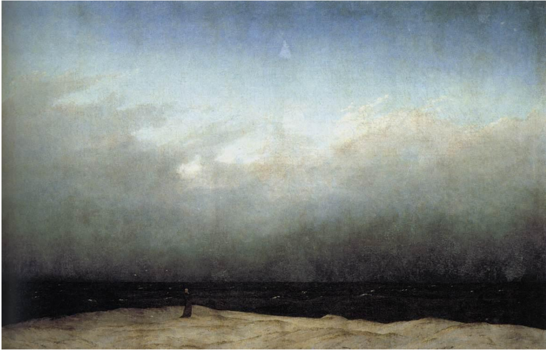
Slika 18 „Redovnik pored mora“