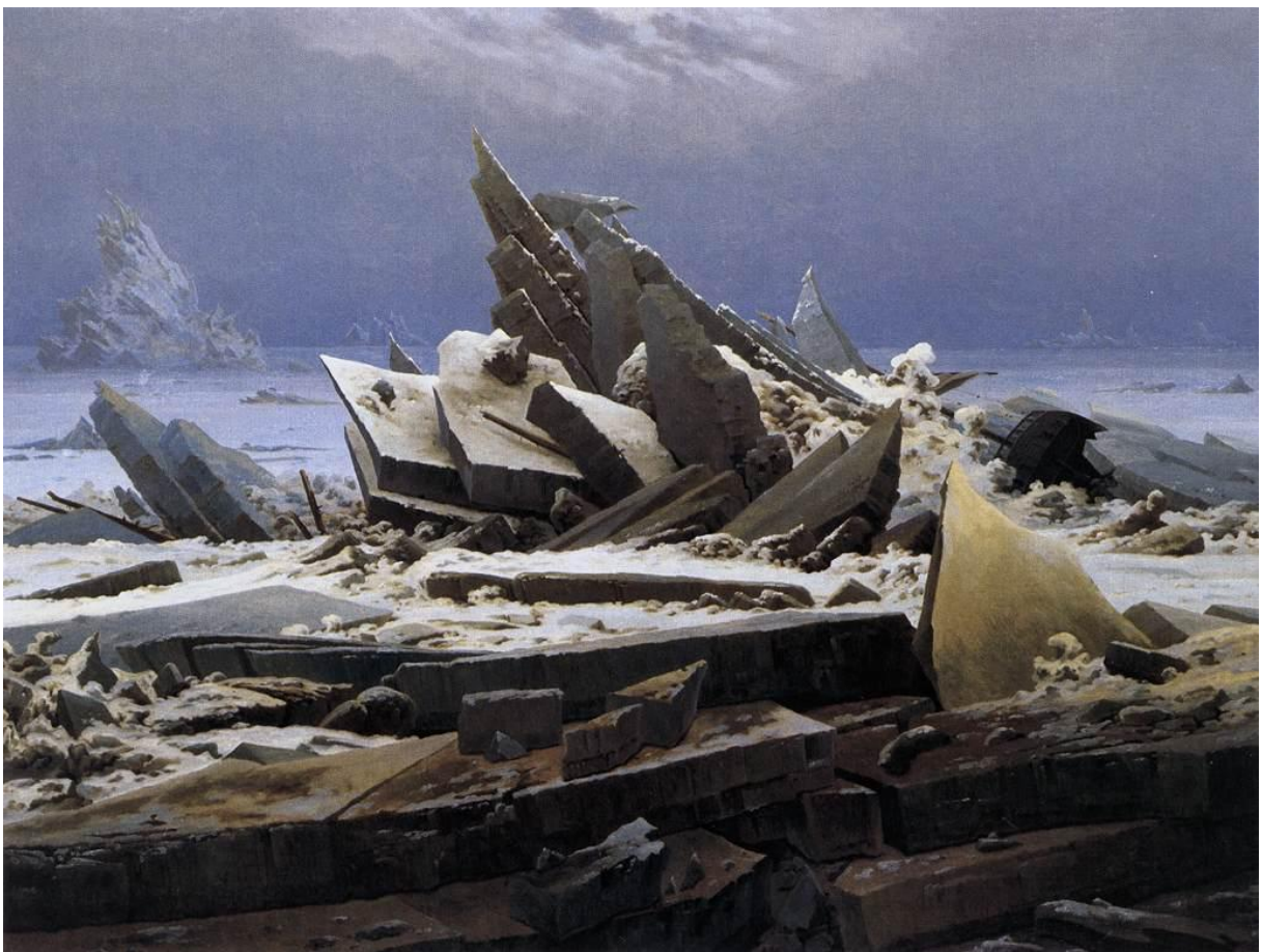
Slika 12 „Ledeno more“