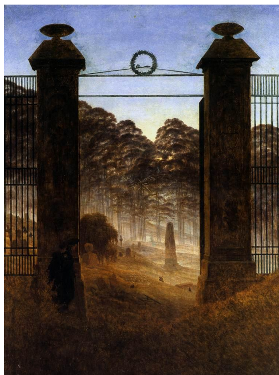
Slika 7 „Ulaz u groblje“