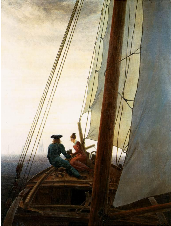
Slika 11 „Na brodu“