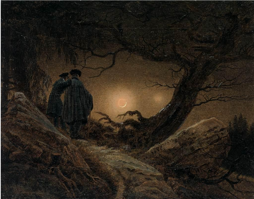
Slika 16 „Promatranje mjeseca“