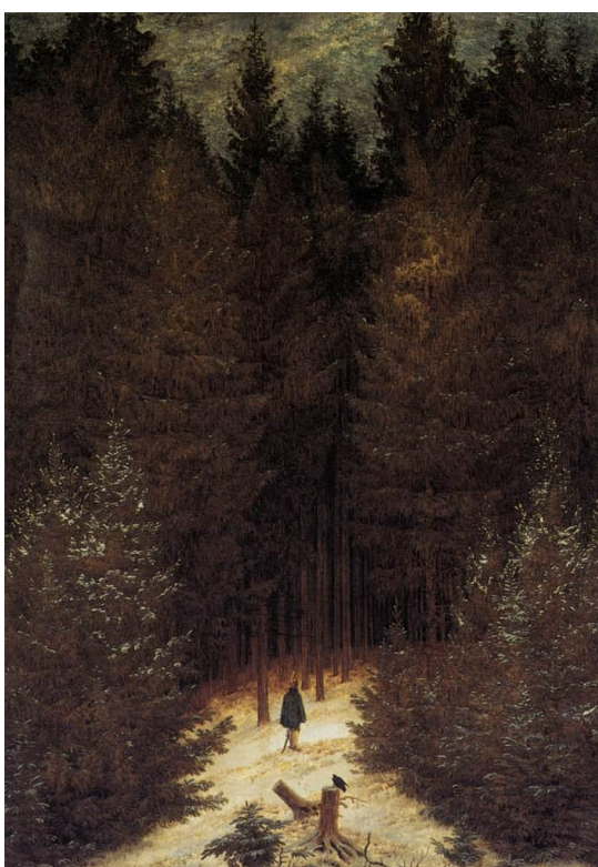
Slika 14 „Lovac u šumi“