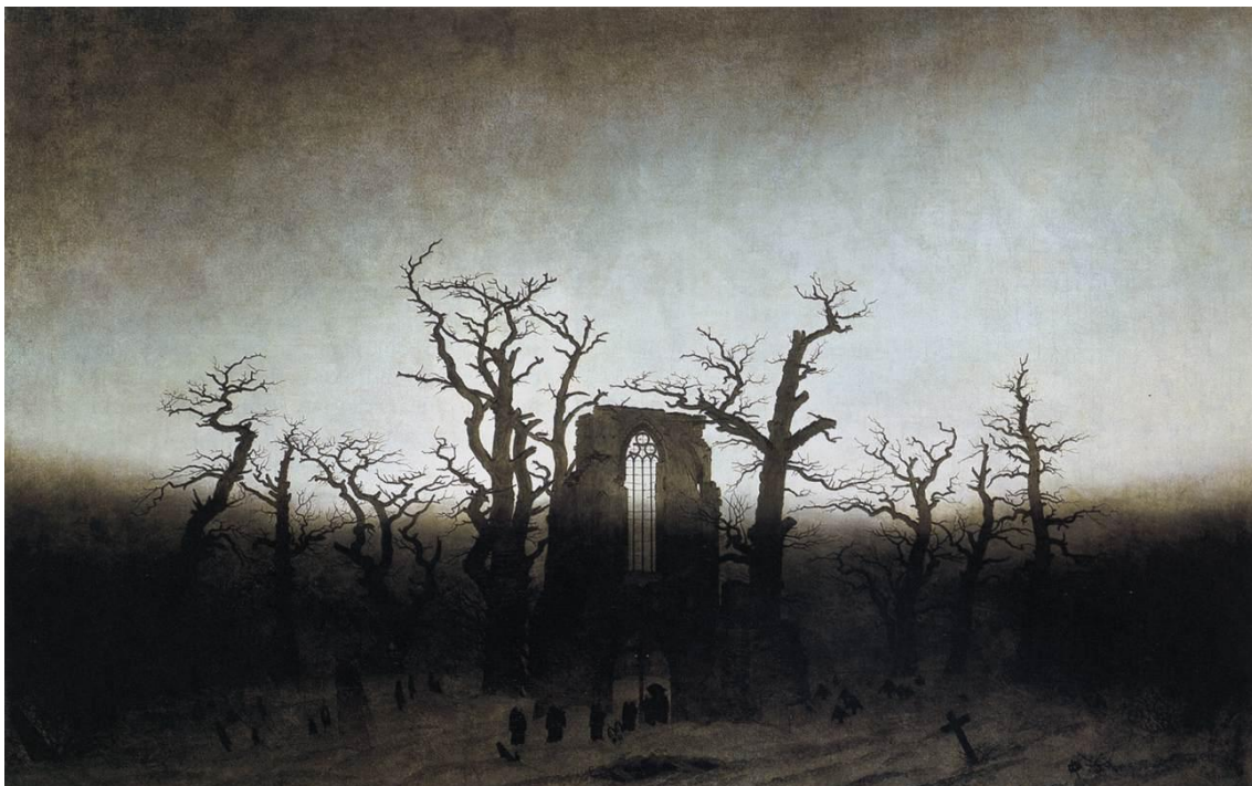
Slika 5 „Opatija u hrastovoj šumi“