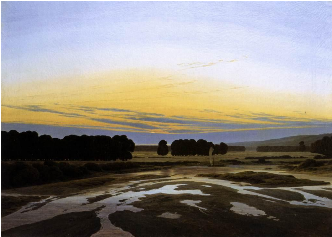
Slika 20 „The Grosse Gehege near Dresden“