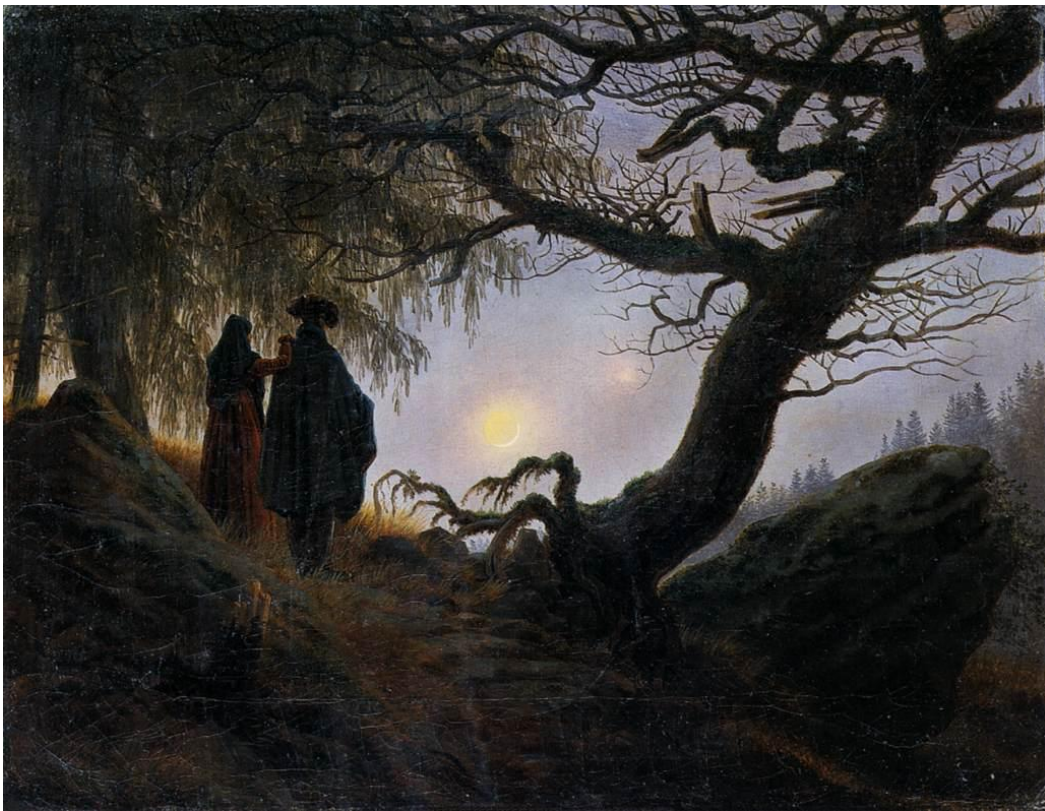
Slika 17 „Muškarac i žena promatraju mjesec“