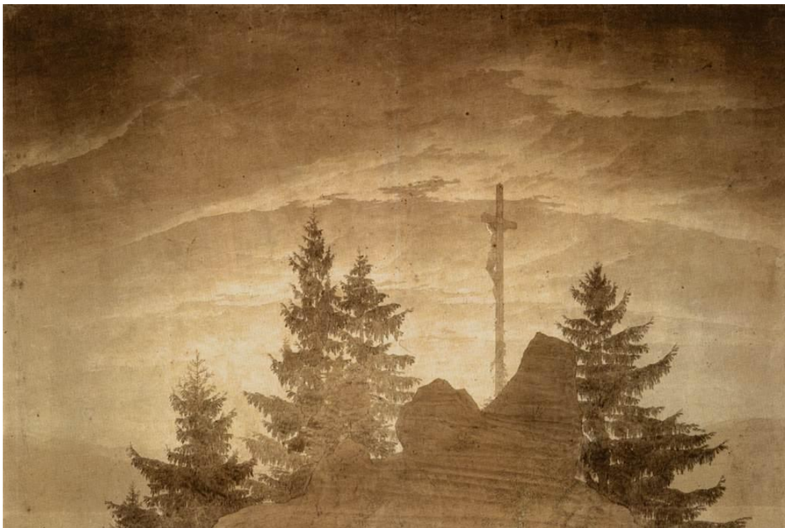
Slika 3 „Križ u planinama“