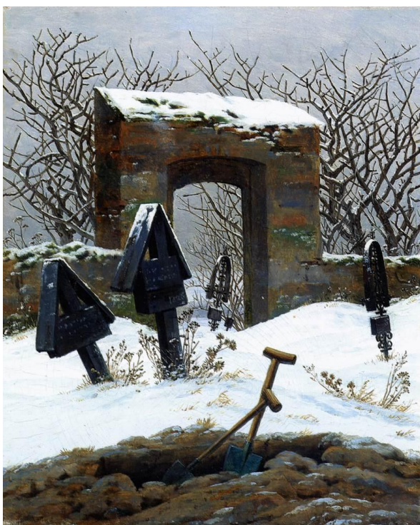
Slika 6 „Groblje u snijegu“