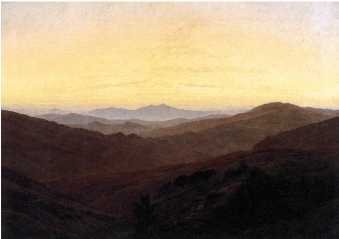
Slika 19 „Riesengebirge“