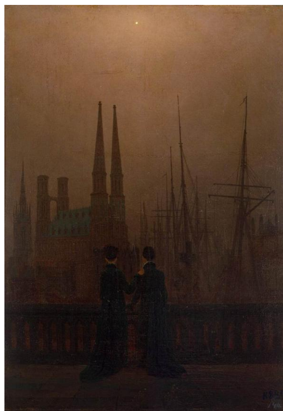
Slika 10 „Sestre na balkonu“