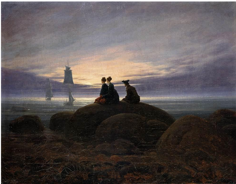
Slika 13 „Izlazak mjeseca na moru“