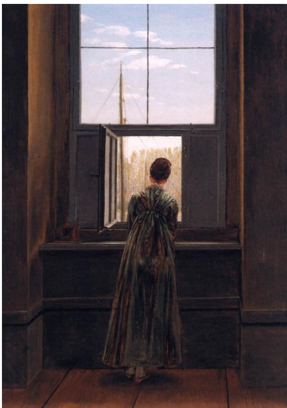
Slika 9 „Žena na prozoru“