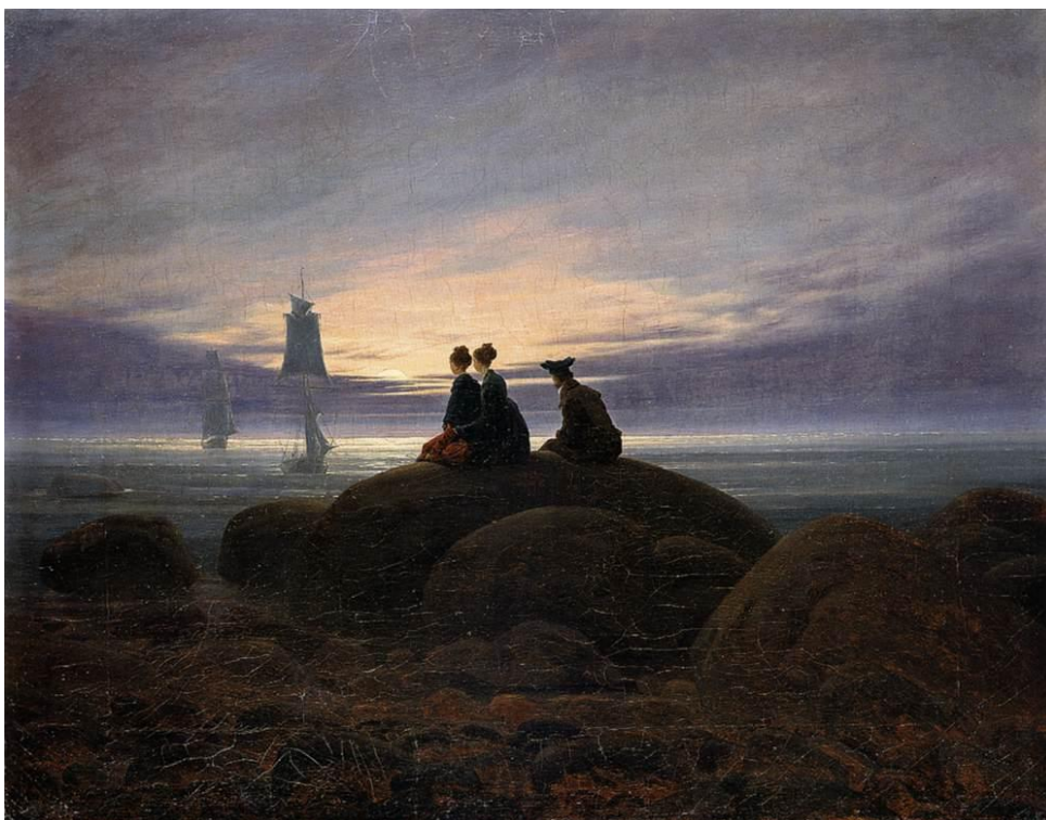
Slika 13 „Izlazak mjeseca na moru“