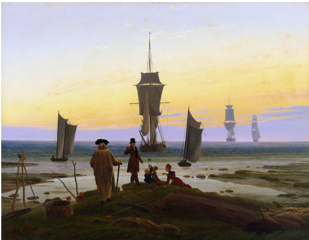
Slika 21 „Ciklus života“