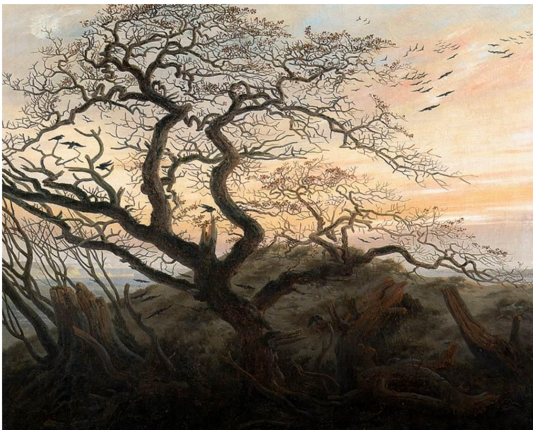
Slika 8 „Stablo s vranama“