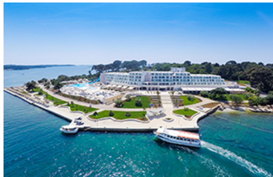
Slika6Valamar Isabella Resort, Poreč