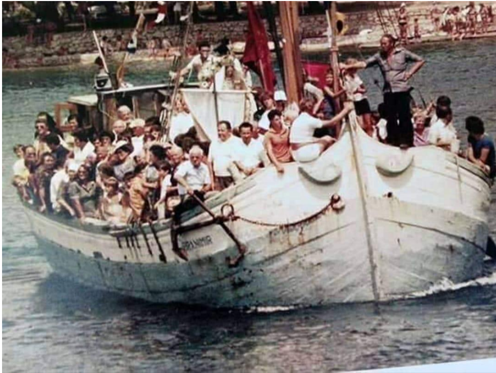
Prilog 24: Prevoženje kipa Gospe od Sniga u trabakulu Branimir 1979. ili 1980. godine 21