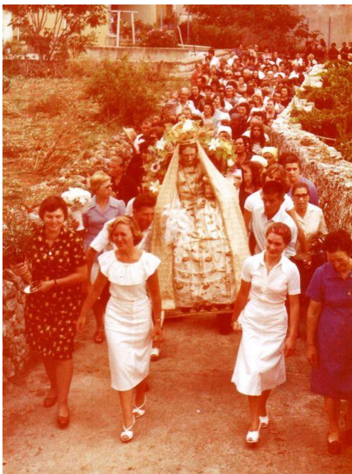
Prilog 23: Procesija 1977. godine