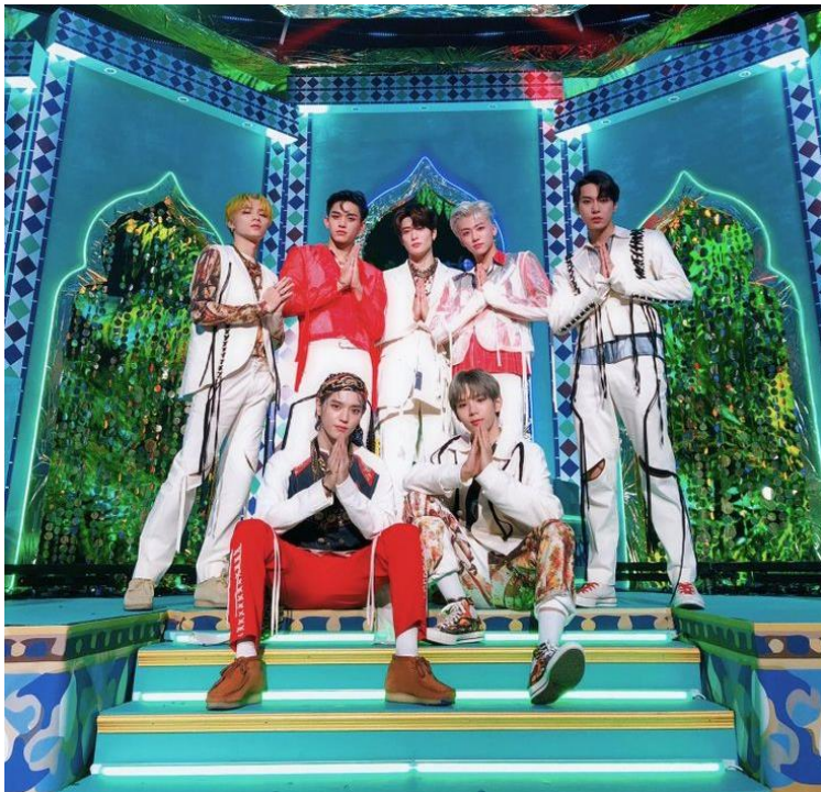
Slika 10. Grupa NCT U