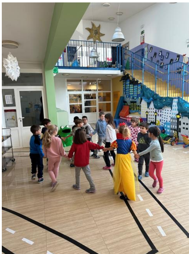
Slika 11. Prikaz pokretne igre

Nakon završene pokretne igre i svih aktivnosti koje smo proveli razgovarali smo o aktivnostima koje su im se svidjele i što bi voljeli ponoviti.