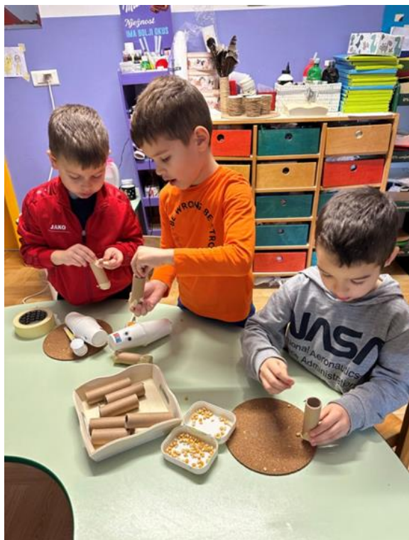
Slika 8. Prikaz izrade šuškalica