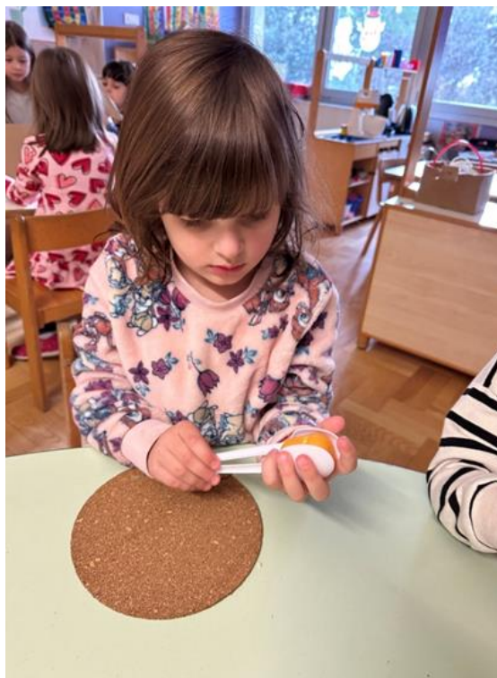
Slika 9. Prikaz izrađene šuškalice