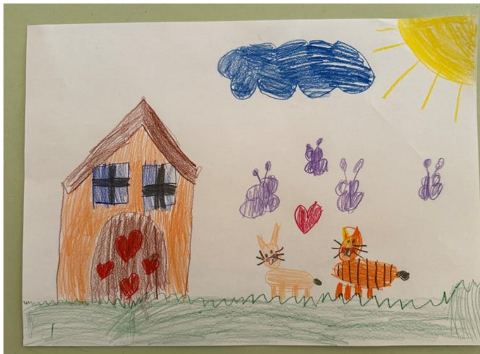
Slika 13. Prikaz Eninog crteža (6 godina)