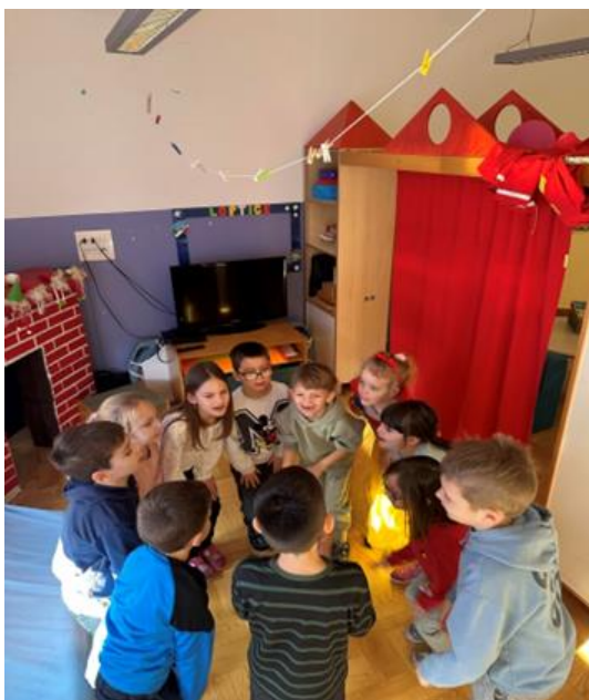
Slika 3. Brojalica u pokretu