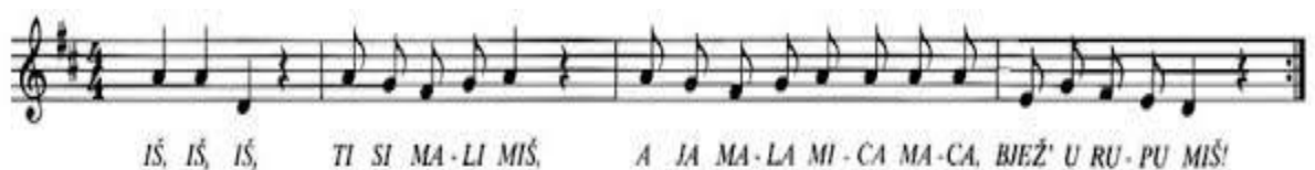
Slika 2. Prikaz notnog zapisa brojalice "Iš, iš, ti si mali miš"

Projekt smo proveli u nekoliko etapa. U siječnju 2024. godine započeli smo s pjevanom brojalicom " Iš, iš, ti si mali miš ", koju su djeca s veseljem poslušala. Nekolicina djece javila se kako im je već ta brojalica poznata te smo ih upitali znaju li još koju brojalicu.