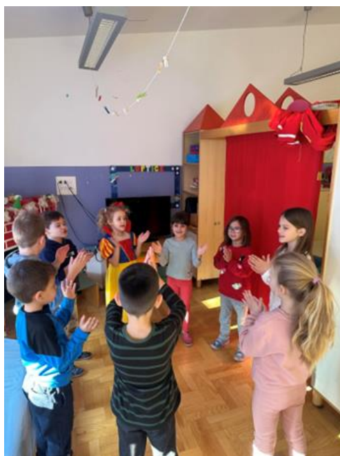
Slika 4. Brojalica u pokretu

Nakon otpjevane brojalice upitali smo ih kako bi mogli dalje nastaviti aktivnost na temu brojalice, djeca su predložila nekoliko ideja: