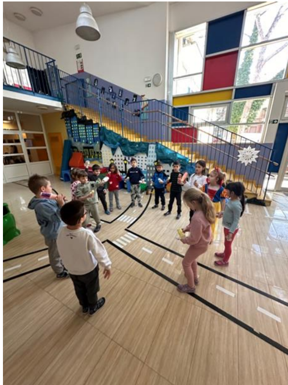
Slika 10. Prikaz brojalice uz ritam šuškalica

Uz pjevanje brojalice koristili smo izrađene šuškalice za ritam.