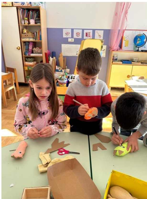
Slika 6. Prikaz izrade lutki za igrokaz

Kada su lutke bile gotove postavili smo paravan za dramatizaciju. Dječaci su složili stolice kako bi mogli gledati predstavu koju su djevojčice pripremile. Djevojčice su prve započele glumu s izrađenim lutkama. Imale se pripovjedača koji je pozdravio publiku i započeo s uvodom.