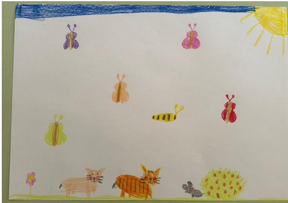
Slika 12. Prikaz Cvitinog crteža (5 godina)