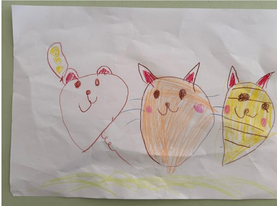
Slika 14. Prikaz Petrinog crteža (5 godina)

Glavni motivi na dječjim crtežima su bile mačke i miševi.