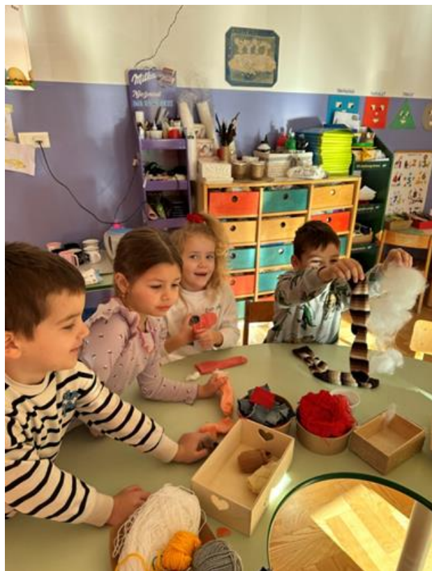
Slika 5. Prilaz izrade lutki za igrokaz