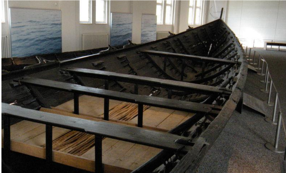
Sl. 5. Brod iz Nydama