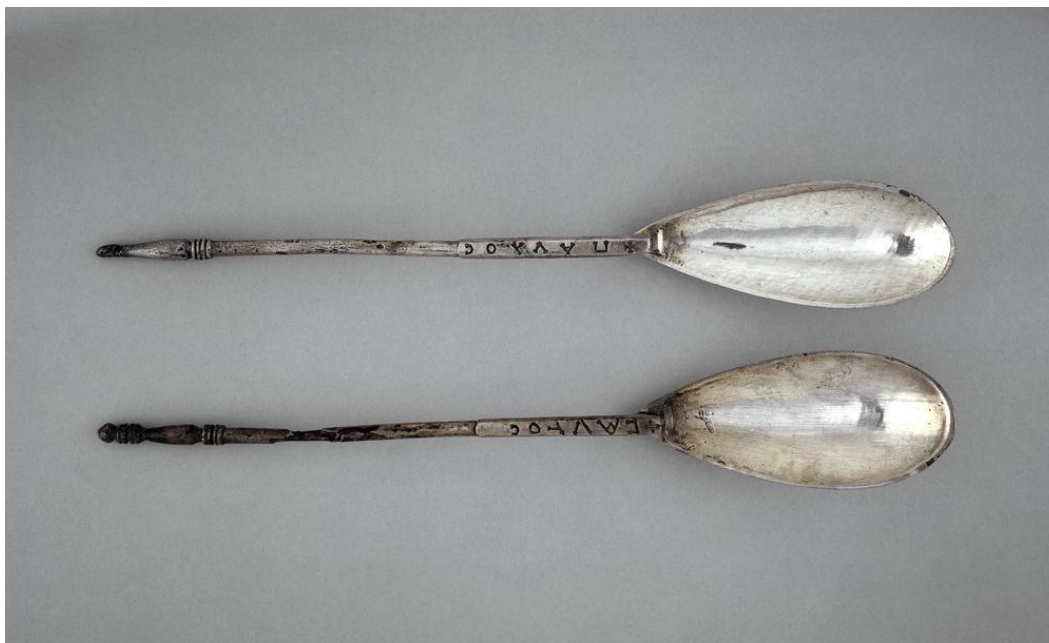
Sl. 11. Srebrne žličice s gravurama “Saulos” i “Paulos”