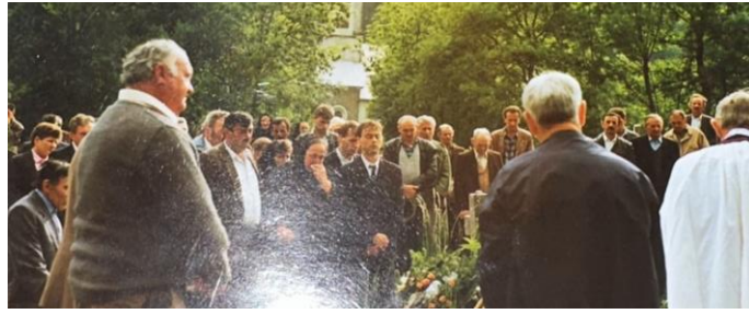
Slika 10 Sahrana