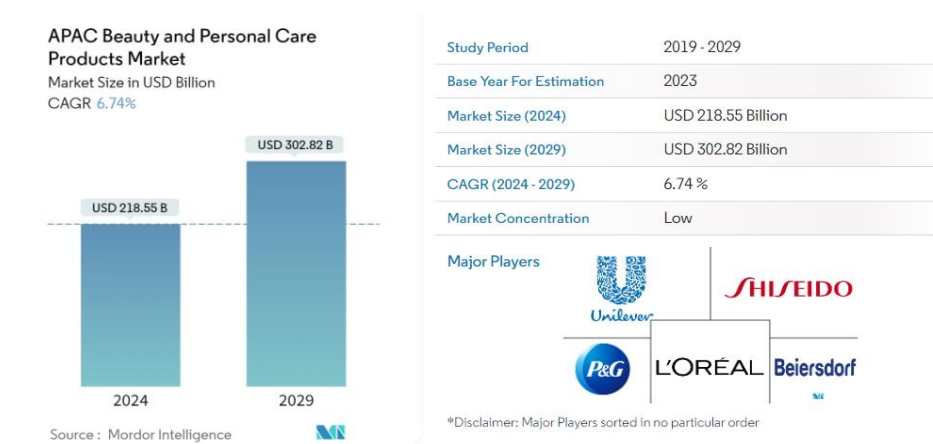
Slika 2: Trendovi azijsko – pacifičkog tržišta kozmetičke industrije 2019. - 2023. godine

Izvor: Asia Pacific Beauty Devices Market Size, Mordor Intelligence: