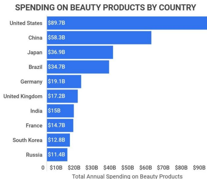
Slika 3: Potrošnja u kozmetičkoj industriji prema zemljama u svijetu za 2022. godinu