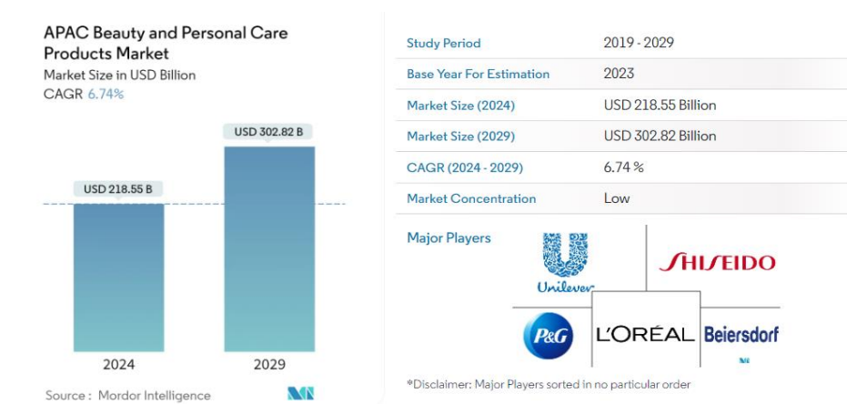
Slika 2: Trendovi azijsko – pacifičkog tržišta kozmetičke industrije 2019. - 2023. godine

Izvor: Asia Pacific Beauty Devices Market Size, Mordor Intelligence: