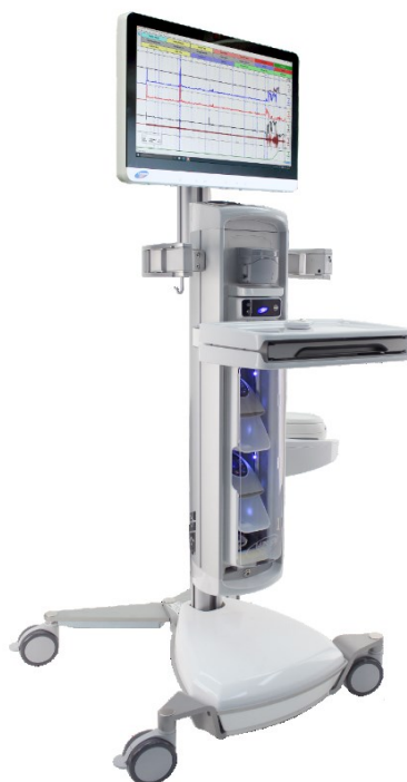
Slika 2. Urodinamski aparat

Dostupno na: https://bioelektronika.hr/laborie/ (7.10.2024.)