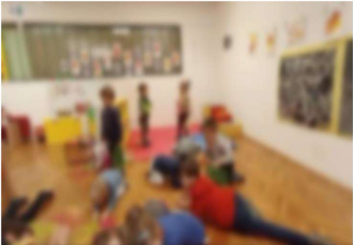
Slika 9. Pokretna igra – valcer cvijeća 2

I sljedeća slika prikazuje pokretnu igru – valcer cvijeća.