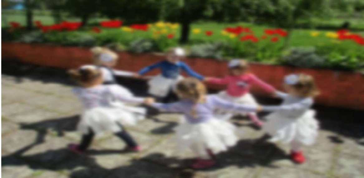
Slika 4. Ples kod djece rane i predškolske dobi