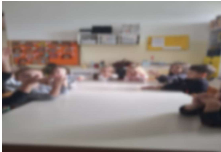
Slika 17. Ritmičke vježbe – tiha brojalice (Mica maca ima brk)

Pri tome djeca posebno vole trenutno vrlo popularnu pjesmu Rim Tim Tagi Dim na koju plešu sa i bez rekvizita.