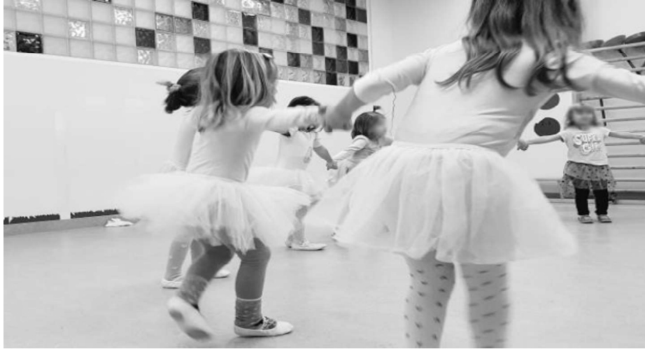
Slika 5. Ritmika i ples u dječjem vrtiću

Izvor: https://www.mali-istrazivac.hr/program-pregled/ritmika-i-ples