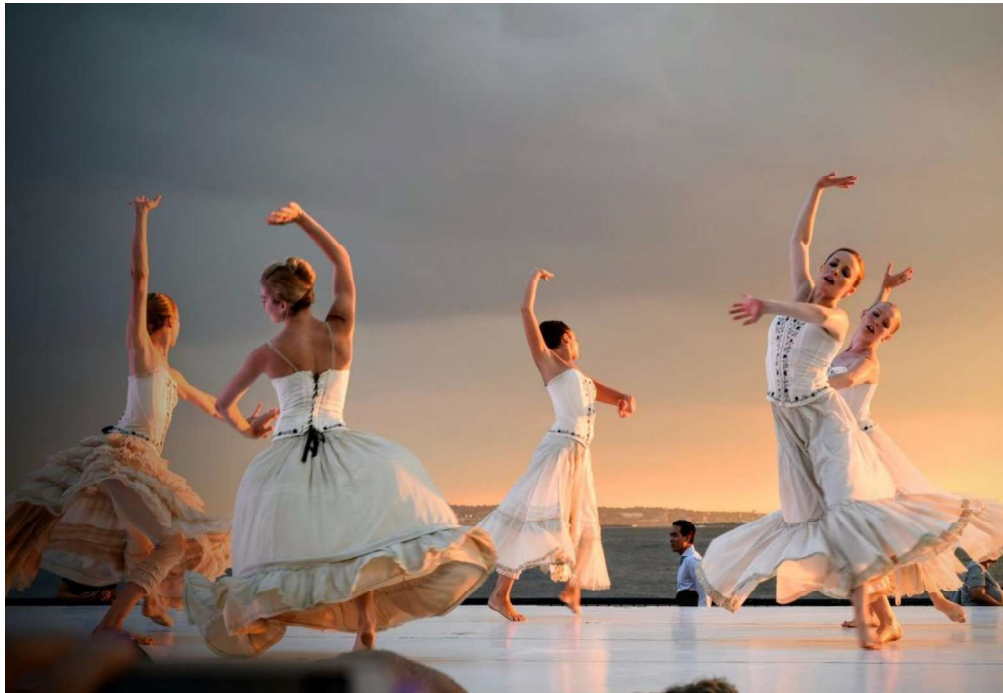
Slika 1. Ples