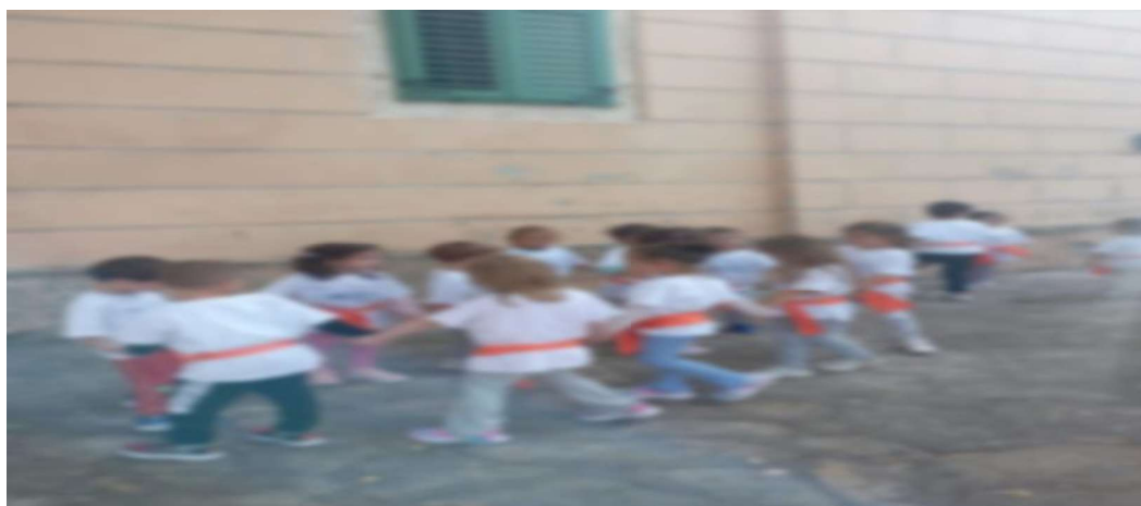
Slika 29. Plesanje kola uz pjesmu Igra, šeta 2

Kod ove skupine djece vrlo je popularna i pjesmica Igra, šeta koja je vrlo slična prethodnoj pjesmici Pleskom, pleskom tata gre, a kod koje se djeca uhvate za spuštene ruke u kolo i koračaju u smjeru kazaljke na satu. Unutar kola korača jedno dijete u smjeru suprotnom od kretanja kazaljke na satu. U određenim trenutku dijete bira jedno dijete (svoj par) iz kola s kojim će zaplesati. Ukoliko odabrano dijete pristane, zajedno odu u sredinu kola, uhvate se naprijed za ruke i koračaju u jednu pa u drugu stranu. Djeca koja su u kolu tada plješću.