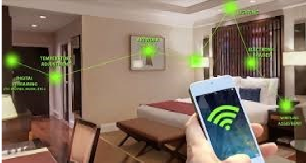
Slika 2. Pametna hotelska soba

Za menadžment hotela jedna od najvećih prednosti stvaranja pametnog hotela su smanjeni troškovi, prvenstveno zbog poboljšanja održivosti i energetske učinkovitosti unutar hotelskih soba, pri čemu se određeni uređaji koriste samo kada su potrebni te održivi hoteli postaju sve važniji. Prema Izvješću o održivim putovanjima Booking.com-a, 70% globalnih putnika vjerojatnije je da će odabrati opciju održivog smještaja (Lacalle, 2024.).