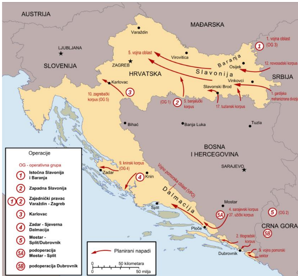
Slika 5. Geografski položaj Slavanskog Broda