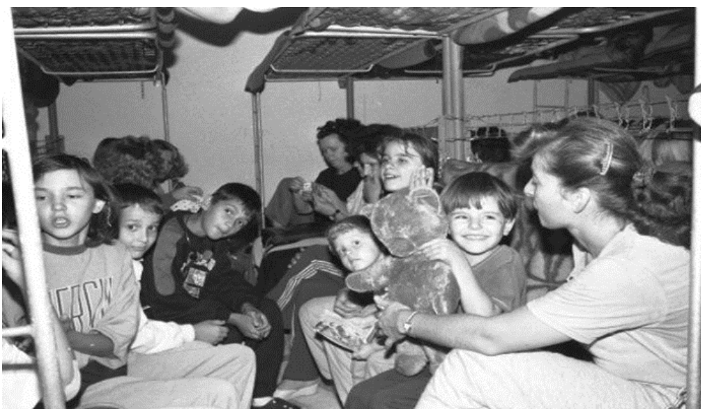
Slika 3. Premještanje stanovništva u skloništa tijekom zračnih napada JNA na Zagreb

Tijekom rata u Hrvatskoj, provedeno je mnoštvo evakuacija, te se može pouzdano tvrditi da su prognanici i izbjeglice bili premješteni iz ugroženih područja u sigurnije zone. Taj proces započeo je već u srpnju i kolovozu 1991. godine. Civilna zaštita imala je ključnu ulogu u organizaciji i provedbi evakuacijskih aktivnosti. Njihova zadaća uključivala je izradu pravila i propisa, osiguravanje prijevoza, koordinaciju prihvata i smještaja te pružanje brige za evakuirane osobe dok nisu bile smještene na sigurnije lokacije (Toth, 2001).