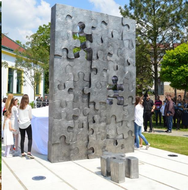
Slika 7. Spomenik „Prekinuto djetinjstvo“