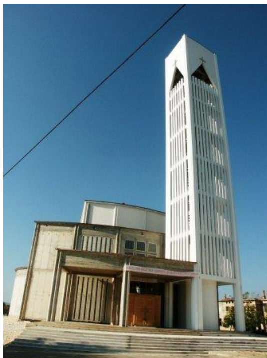
Slika 3. Nova župna crkva sv. Nikole u Kistanjama 53

„Crkva središte zbivanja, događanja... Kupiš novu robu, kupuješ je za crkvu. Da ideš na misu. Pa moraš biti lijepo obučen. Nema tu špice, šetnice, ne znam ja... Što je totalno kontradiktorno [Zadru, op. a]... E, što subotom idemo van... Ti se tip top oblačiš zato što ideš na misu. Zato što je događanje na Svetoj misi. (...) Uglavnom, crkva je bila središte i dan danas se to nastavilo. To se vidi... Jer vidiš kolika nam je velebna crkva! Ono... Bitno da se on [Zvonik, op. a.] vidi! Zvonik da je to... Kistanje ima crkvu pa vi pričajte šta hoćete! Šta je je, treba nam takva crkva. Jer mi stvarno, ono,... (...) nas je tisuću i nešto. I stvarno da.... Velebna crkva se i napuni. Tako da nisu falili.“ – Kazivačica M. (1995.)