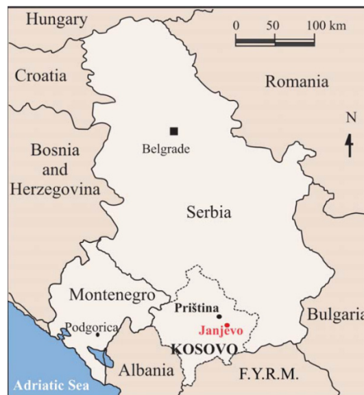
Slika 1. Geografski položaj Janjeva na karti

djelatnosti. Prvi doseljenici najprije su osnovali privremene naseobine iz kojih su se kasnije razvila stalna naselja. Jedno od tih naselja bilo je i Janjevo 20 . Prvi pisani spomen Janjeva, odnosno župe Janjevo, nalazi se u pismu pape Benedikta XI. upućenom barskom nadbiskupu Marinu iz 1303. godine 21 . Nerijetko se spomenuta godina uzimala kao godina osnivanja mjesta Janjevo, no gotovo sa sigurnošću može se reći da je naselje osnovano ranije od prvog spomena. (Čolak i Mažuran, 2000:19-23).