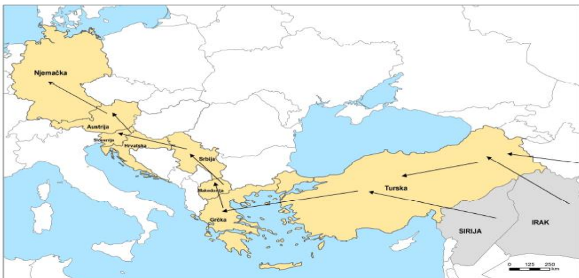
Slika 1 Smjerovi kretanja izbjeglica i drugih prisilnih migranata Istočnomediteranskom i Balkanskom rutom

čemu ističu talijansku operaciju Mare nostrum 39 tijekom 2014. godine, zajedničke operacije Frontexa (Frontex Joint Operation) Triton i Posejdon, te nacionalne mornarice, obalne straže, trgovačke i druge brodove koji su pomogli u spašavanju života (European Parliament, 2015, prema Brian i Lacko, 2016). Istraživači IMIN-a (2016), ističu da je operacijom „Mare nostrum“ spašeno oko 150 000 izbjeglica na Mediteranu. Nakon što je nadležnost za nastavak operacije u listopadu 2014. godine preuzela Agencija za zaštitu vanjskih granica EU-a Frontex (akcije Posejdon i Triton), akcije su se nastavile provoditi, „ali primarno s ciljem patroliranja, kontrole odvratanja te vraćanja brodica na teritorij polazišta – obale Sjeverne Afrike“ (IMIN, 2016: 4). Istraživači IMIN-a (2016) smatraju da je ova promjena rezultirala povećanjem nesigurnosti prelaska, povećanjem cijena krijumčarenja te smanjivanjem migracijskih tokova na Srednjomediteranskoj ruti (iz Sjeverne Afrika preko Lampeduse do Malte i Italije). Istraživači smatraju da su te promjene utjecale na preusmjeravanje migracijskog toka na Istočnomediteransku rutu (od Turske do grčkih otoka u Egejskom moru) koja se nastavljala na Balkansku rutu te od nje do država obuhvaćenih Schengenskim sustavom (slika 1) (IMIN, 2016).