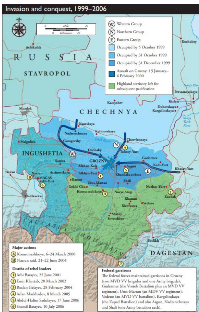
Slika 5 Invazija i osvajanje Čeče nije 1999. - 2006. 48

koridore gdje nema minskog polja te su ta područja zauzeli, a ostavili područja slobodna s minama. 47 Već 15. 1. Viktor Kazanstev je odlučio ulazak ruske vojske u Grozni jer nikog više, osim civila, nije bilo u gradu. Unatoč svemu, događale su se situacije gdje su mali broj čečenskih boraca ulazilo među ruske linije i postavljale mine kako bi se usporilo napredovanje vojske. 6. 2., grad Grozni bio je, prema Rusima, oslobođen. Ljudi koji su ostali u Groznom, živjeli su u nehumanim uvjetima i imali su otežani pristup hrani. Kako je napad na Grozni bila prva crta napada, tako je zauzećem došlo do odlaska dijela ruske vojske na drugu frontu koja se protezala kroz sela i unutrašnjost Čečenije koju su dio po dio zauzimali. Neka područja lakše, neka teže.