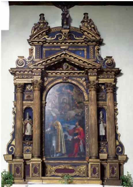
Slika 6 Girolamo Ridolfi, Oltar sv. Stjepana terminus post quem 1643., Crkva sv. Frane, Šibenik