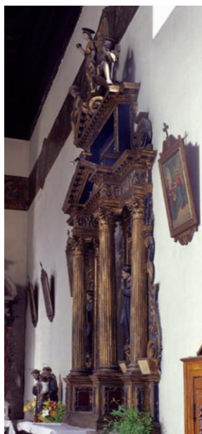
Slika 8 Issepo Ridolfi, oltar sv. Klare, 1638., Crkva sv. Frane u Šibeniku