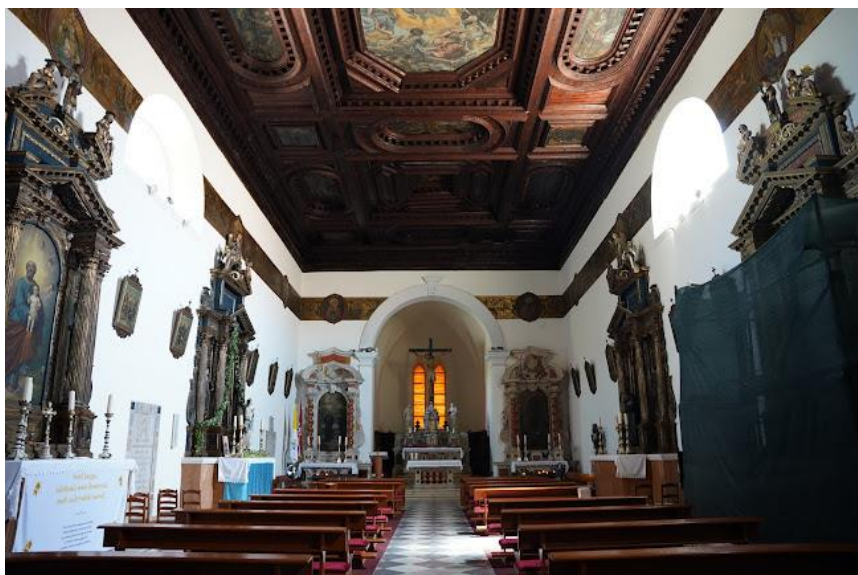
Slika 3. Unutrašnjost crkve sv. Frane u Šibeniku u današnjem stanju