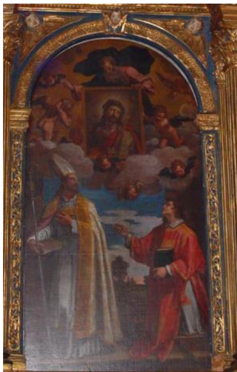
Slika 10 Matteo Ponzone, Pala s prikazom sv. Augustina i sv. Stjepana, 1634., Crkva sv. Frane u Šibeniku