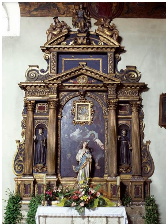
Slika 4 Issepo Ridolfi, oltar Bezgrešnog začeća, 1638., Crkva sv. Frane u Šibeniku