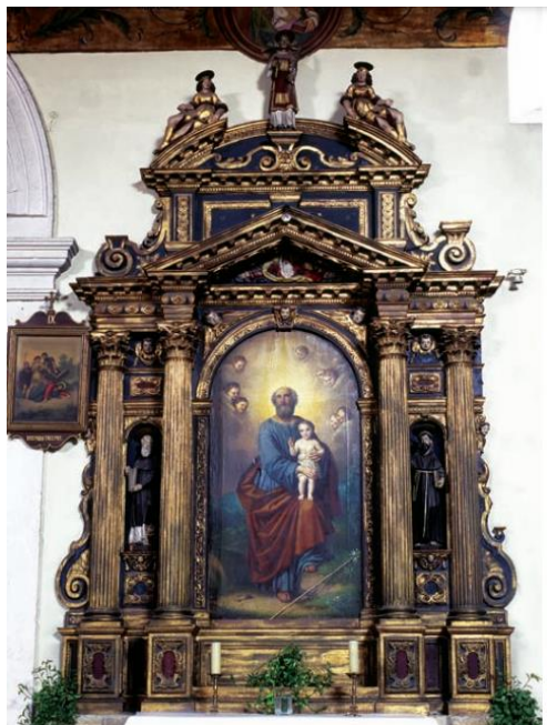
Slika 7 Girolamo Ridolfi, Oltar sv. Josipa, terminus post quem 1643., Crkva sv. Frane, Šibenik