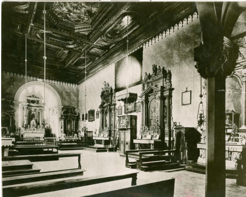
Slika 1. Unutrašnjost crkve sv. Frane u Šibeniku, fotografija stanja u 19. stoljeću