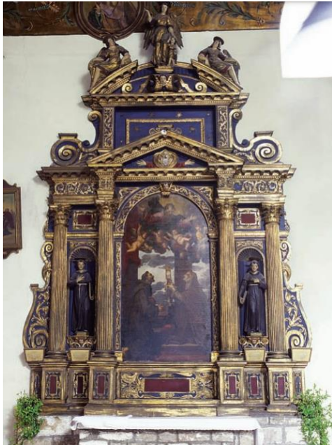
Slika 5 Issepo Ridolfi, oltar sv. Klare, 1638., Crkva sv. Frane u Šibeniku