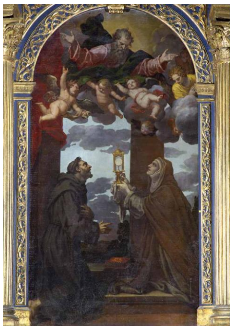
Slika 9 Matteo Ponzone, Oltarna slika s prikazom sv. Antuna i sv. Klare, 1638., Crkva sv. Frane u Šibeniku