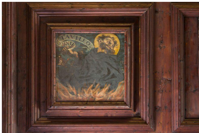
Slika 13 Radionica Giovannija Battiste Volpata, Mučeništvo sv. Nikole Tavelića, strop crkve, 1674., crkva sv. Frane u Šibeniku