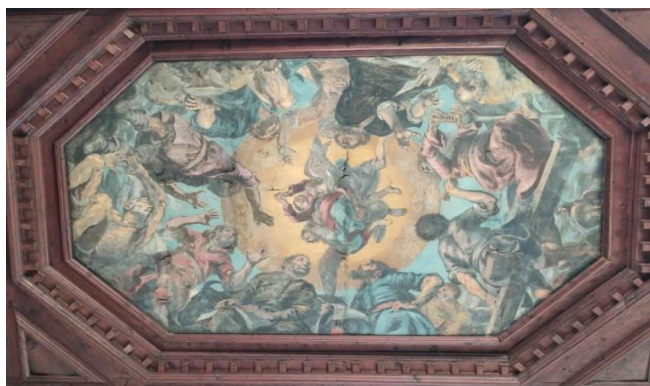
Slika 14 Radionica Giovannija Battiste Volpata, Uznesenje Bogorodice, stropna slika, 1674., crkva sv. Frane u Šibeniku