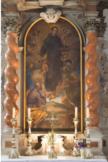
Slika 11 Matteo Ponzoni, Pala sv. Antuna sa sv. Josipom i sv. Onofrijem, 1655., crkva sv. Frane u Šibeniku (izvor: https://svetiste-sibenik.hr/crkva/ )