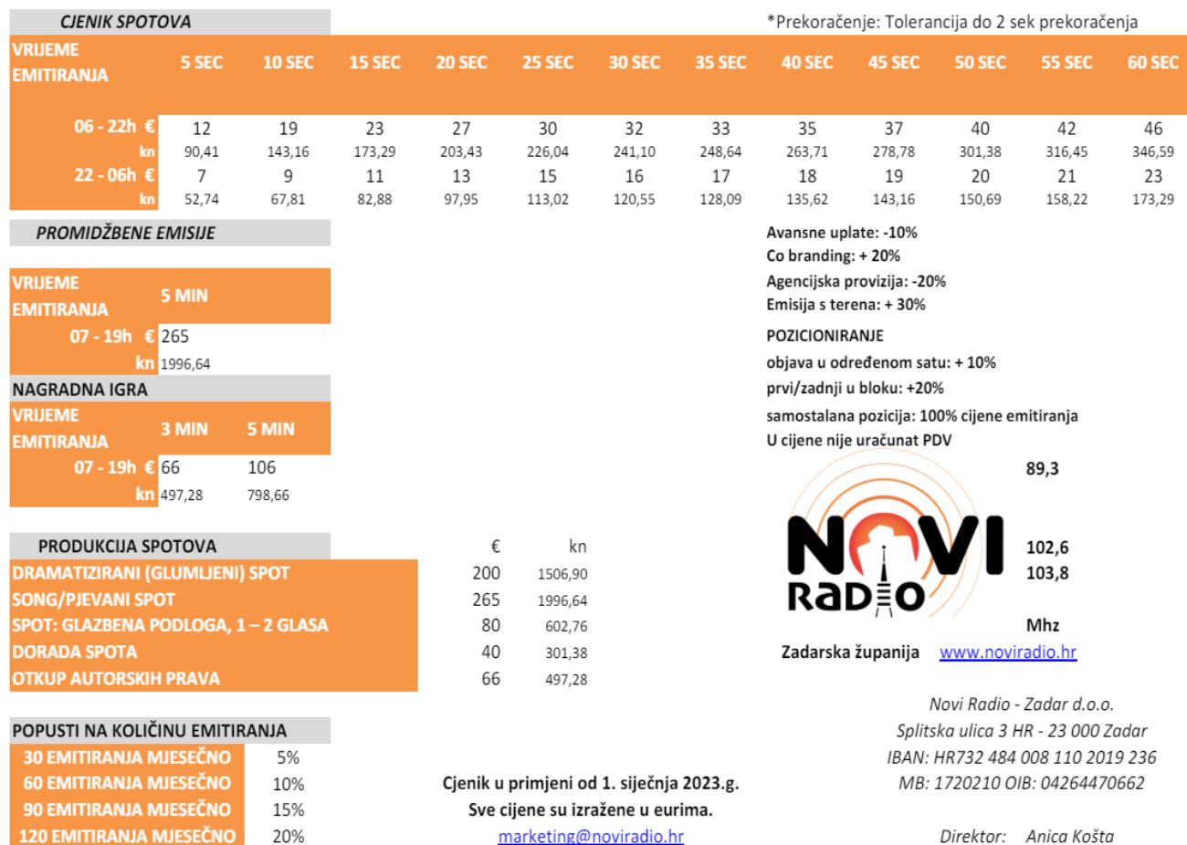
Slika 5: Cjenik oglašavanja na radiju Novi Radio