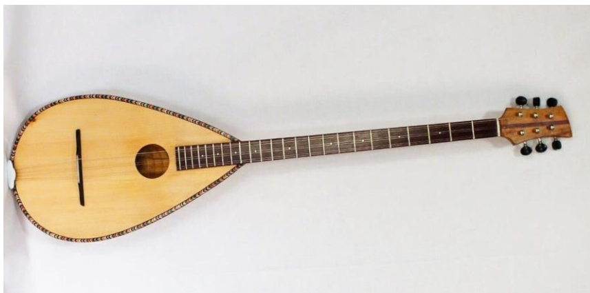
Slika 2: Tambura