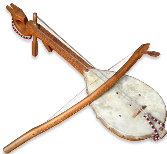
Slika 1: Gusle

Također, bitno je navesti i tambure koje služe kao pratnja pri izvođenju narodnih pjesama. Tambure imaju dvije metalne žice po kojima se zvuk postiže posebnim trzajima. Tambure se upotrebljavaju isključivo u zapadnim krajevima, dok su gusle rasprostranjene na područjima poput: Hrvatske, Bosne i Hercegovine, Crne Gore... Tambura, kao i gusle, služe kao melodijska pratnja pjevaču pri izvođenju epskih pjesama. Takve epske pjesme sadrže staru, arhaičnu glazbenu formu te u sebi imaju obilježja svečanog i uzvišenog: „ stoga je svako uspješnije pjevanje epskih pjesama i sviranje uz gusle izazvalo izvjesnu obrednu ozbiljnost, atmosferu svečanog i plemenitog epskog patosa. “ (Čubelić, 1970: XLVIII) Ipak, ne izvode svi pjevači epske pjesme pomoću gusala i tambura. Određeni pjevači epske pjesme izvode kazivanjem ili recitiranjem bez ikakve glazbene pratnje. Za primjer takvog kazivača, bez glazbene pratnje, može se navesti Tešana Podrugovića, dok je Filip Višnjić jako dobar primjer za pjevača uz pratnju gusala. Također, Čubelić navodi i Mehmeda Kolakovića koji je svoje pjevačke sposobnosti pokazivao uz pratnju tambure. (Čubelić, 1970: XLVIII)