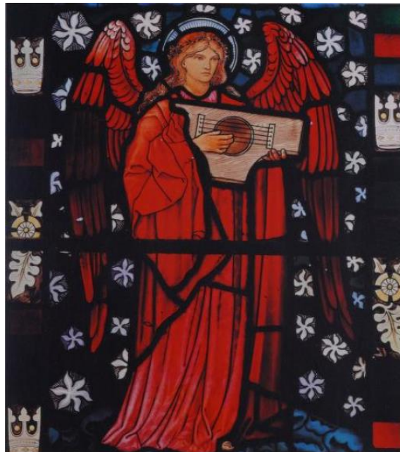
Slika 6. Morris, Marshall, Faulkner & Co., Vitraj s prikazom anđela u crkvi Sv. Petra i sv. Pavla, Cattistock, Dorset, 1882.