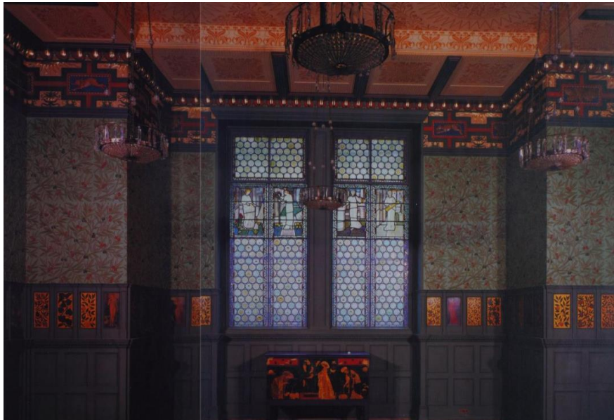
Slika 8. Morris & Co., Interijer tzv. Zelene blagovaone, South Kensington muzej (današnji Viktorija & Albert muzej), London 1866.