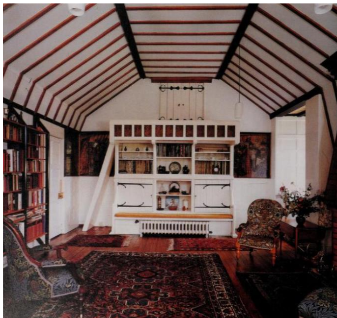
Slika 3. Suradnja Morrisa, Webba i dr., Crtaća soba u kući Red House , Beaxleyheath, 1859.