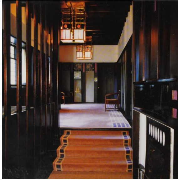
Slika 5. Mackintosh, Ulazni dio kuće Hill House , Helensburgh, Škotska, 1902.