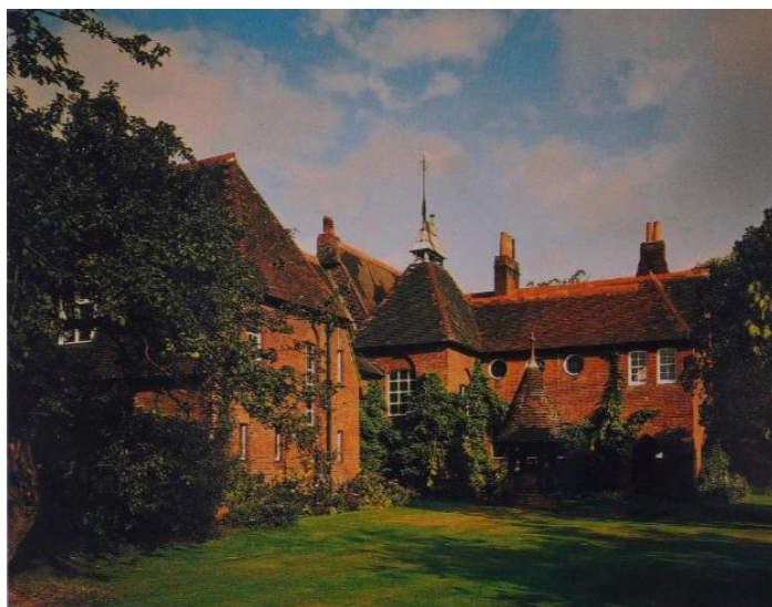
Slika 2. Philip Webb, Vanjski izgled kuće Red House , Bexleyheath 1859.