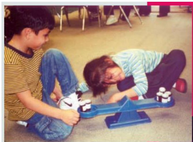
Slika 2 Pan balansne vage