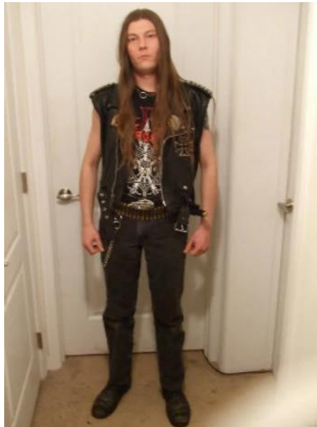
Slika 2. Prikaz „klasičnog“ metalca