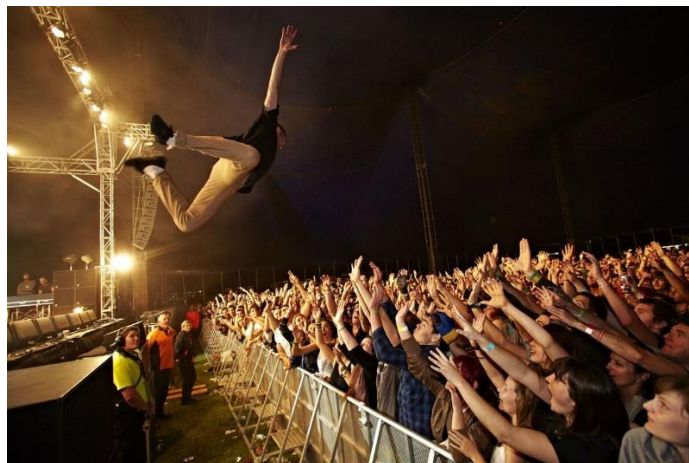
Slika 8. „Stage diving“