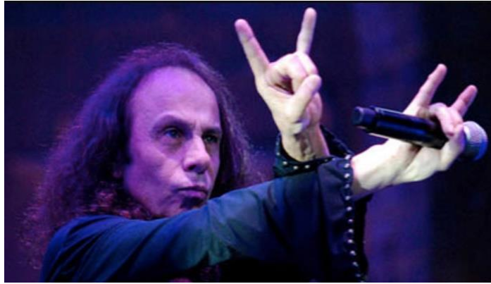
Slika 13. Ronnie James Dio- „devil horns“ ili vrazji rogovi (Preuzeto 9.8.2024. sa https://musicfestivalexplorer.com/who-invented-devil-horns/ )

sloboda i otpor protiv društvenih ograničenja. Simbol pentagrama (Slika 15) na omotima albuma većinski se koristi kako bi se prikazao pseudo-mistični identitet benda, što je još od vremena Black Sabbatha učinkovito pridonosilo komercijalnom uspjehu albuma. Heavy metal subkultura je jedna od najbuntovnijih subkultura te korištenje ovih simbola to potvrđuje (Weinstein, 2000; Phillips i Cogan, 2009).