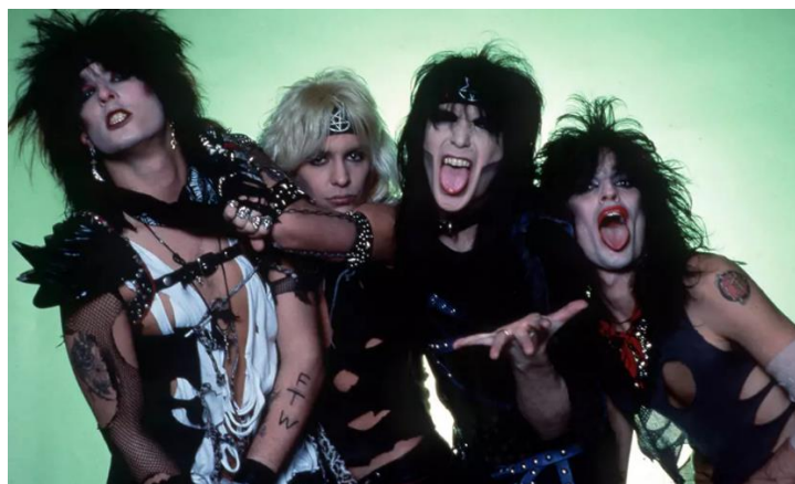
Slika 11. Glam metal bend Mötley Crüe (Preuzeto 29.7.2024. sa https://www.cityliveglasgow.com/journalism/2024/5/28/the-best-dressed-glam-metal-bands-of-all-time )