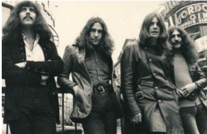
Slika 1. Prvi začetnici heavy metala- Black Sabbath.