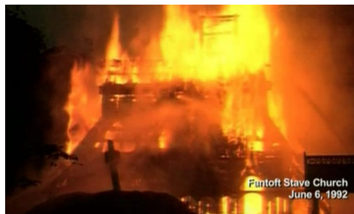
Slika 15. Prikaz gorenja crkve Fantoft u Bergenu