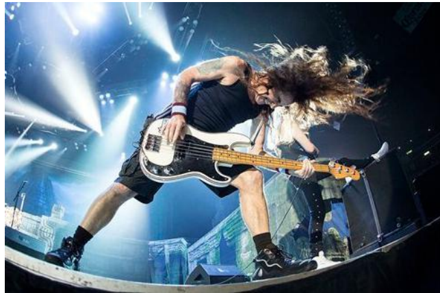
Slika 7. „Headbanging“ - Steve Harris (Iron Maiden)