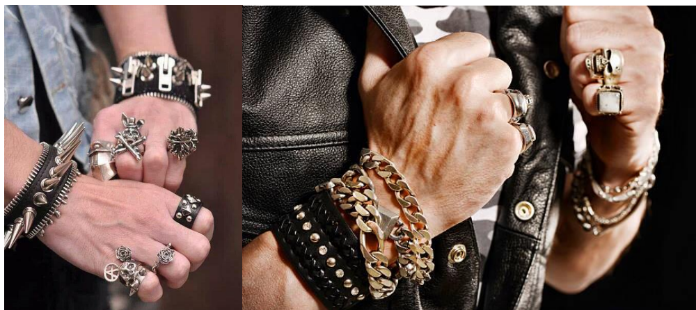
Slika 4. i Slika 5. Primjer nakita (Preuzeto 17.7.2024. sa https://x.com/wealternative i 18.17.2024. sa https://www.gettyimages.com/search/2/image?alloweduse=availableforalluses&family=creative&phrase=rock%20jewelry&sort=mostpopular )