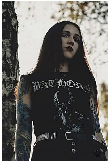
Slika 6. Pripadnica heavy metal subkulture