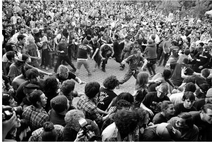
Slika 9. „Moshing“