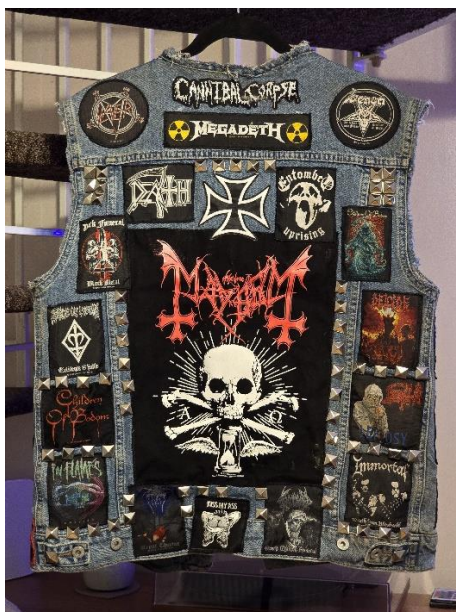
Slika 3. Traper prsluk s prišivcima