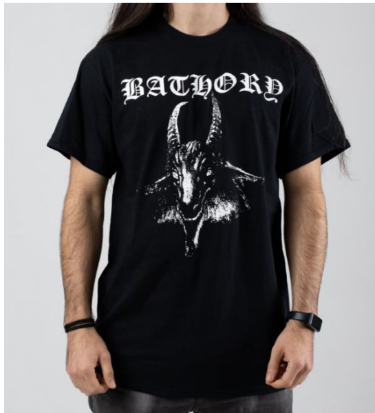
Slika 10. Majica s logotipom benda Bathory- Bafomet (Preuzeto 29.7.2024. sa https://www.impericon.com/products/bathory-goat-t-shirt )